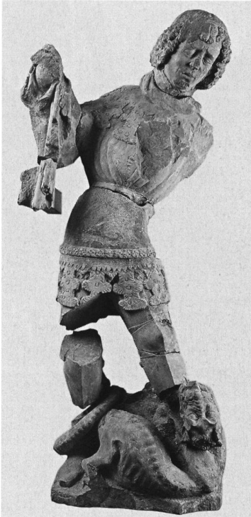
3: Bern, Skulpturenfund der Münsterplattform. Im Bildersturm von 1528 zerstörte, in Portionen zerteilte Figur des hl. Georg. Gesicht zerhackt.

auch ungefähr die Ausdehnung der bei heftigem Nordostwind wütenden Katastrophe. 8 Im Anschluss an die Katastrophe wurde der wegen Stadterweiterungen bereits innerstädtisch gelegene Stadtgraben verfüllt. 1000 Freiwillige sollen Brandabraum in diese Lücke gekarrt haben. So fanden wir denn im fraglichen Bereich massenweise Brandschutt. Um den Graben besser erreichen zu können, wurde nördlich neben dem Zeitglockenturm ein Haus abgebrochen, obschon es lediglich ausgebrannt war (Abb. 2). Die Lücke besteht bis heute. Im Befund fanden wir die entsprechenden Belege: die Brandrötungen in situ und die Brandschicht, direkt darüber die Abbruchschichten. Der Bezug ist für diesmal eindeutig.