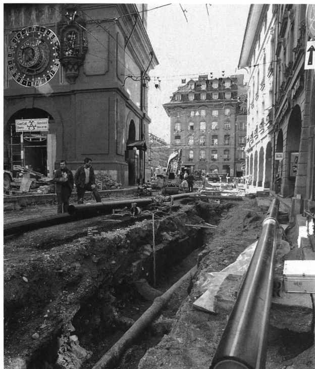
2: Bern, Zeitlockenturm. Archäologischer Befund des Stadtbrandes von 1405.

Viele Beispiele von ebenso berühmten Naturkatastrophen ermangeln gegenwärtig noch konkreter archäologischer Befunde, so der Seesturz von Zug, der am 4. März 1435 26 Häuser und 60 Menschen im Zugersee versinken liess. Oder es wäre zu nennen der Bergsturz von Plurs im