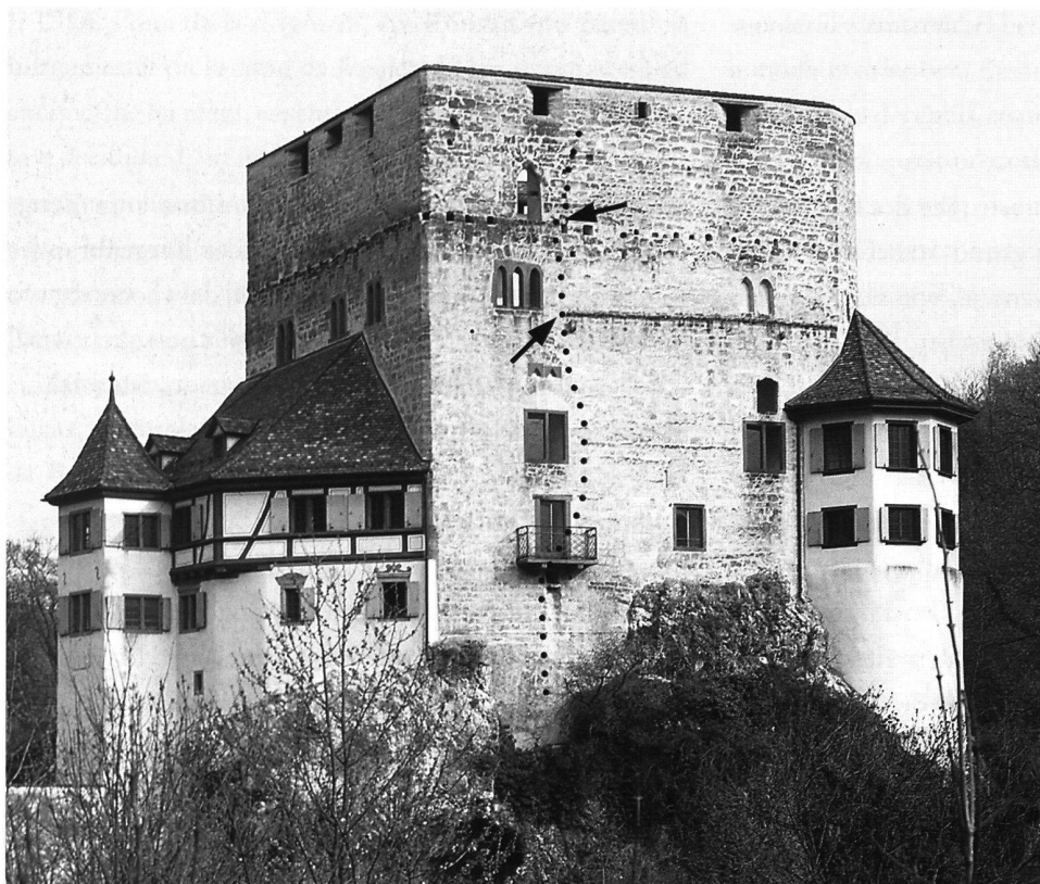
1: Duggingen, Ruine Angenstein von Süden. Gepunktet die Abbruchlinie der im Basler Erdbeben von 1356 eingestürzten Partie.

nellen Ereignisgeschichte hin zur Kulturgeschichte. V.a. im Gebiet der Mittelalterarchäologie eröffnete sich ein weites Feld zur Erforschung der nichtschriftlichen Geschichte, der Lebensgewohnheiten, der sozialen Schichtungen, der Alltagsgeschichte. Die neuen Ziele hiessen: Hirsebrei und Hellebarde; Küche, Kemenate oder Bettelmönch! Die Forschung wendet sich ab von der «schriftwürdigen» Gesellschaft – hin zum einfachen Hirten und Handwerker.