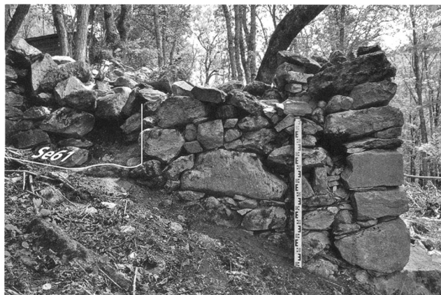
2: Fang VS / Tiébagette. Elévation du bâtiment B5 – Erhaltenes Mauerstück von Bau B5.

l'élément qui va caractériser la maison traditionnelle valaisanne dès le XIV e siècle. Couvrant une surface double des bâtiments à volume unique, ces maisons sont formées d'un premier local excavé, à l'ouest (L1), situé en contrebas du second, à l'est (L2). Le local 1 correspond à une cave semi-enterrée maçonnée, servant de fondation pour le reste des aménagements. Celle du bâtiment B5 intègre deux blocs effondrés employés comme assise solide pour l'édifice. L'étage est constitué d'une pièce en bois sur l'avant et d'une pièce en maçonnerie à l'arrière (L2), qui contenait l'âtre. Il est entendu que les vestiges boisés n'ont laissé aucune trace sur le site, mais il ne fait nul doute que les élévations étaient construites en matériaux périssables. Ainsi, seules les deux pièces maçonnées sont encore visibles aujourd'hui. La compréhension de ce plan a été facilitée par les parallèles existant encore aujourd'hui dans le Val d'Anniviers.