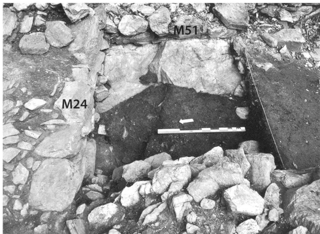
4: Fang VS / Tiébagette. Sondage 1, vue est. Mur ouest (M51) du bâtiment B7 et mur nord (M24) du bâtiment B14. Au fond du sondage, couche noire charbonneuse. – Blick von Osten auf Schnitt 1. Westmauer M51 von Bau B7 (oben) und Nordmauer M24 von Bau B14 (links). Am Boden des Schnittes eine schwarze holzkohlenhaltige Schicht.

gette est un lieu de production et qu'il est par conséquent habité, du moins une partie de l'année. 17 Un nouveau bâtiment (B14) est construit après le comblement de la fosse. Il remploie dans ces murs des pierres issues de l'ancien édifice B7. Cette construction n'est plus maçonnée et ses parois montées à sec devaient accueillir une superstructure en bois. Tout semble indiquer qu'il s'agit ici d'un bâtiment utilitaire, peut-être une grange-écurie. Les résultats du sondage 2 (S2) sont peu probants, car l'arrachage ancien d'un arbre a détruit en profondeur tout niveau archéologique. Pour terminer sur ces deux premiers sondages, deux conclusions sont permises. Tout d'abord, s'il n'est pas possible d'établir depuis quand le site est occupé, il est certain qu'il l'était au XV e siècle. L'occupation permanente du site semble perdurer jusqu'au XVI e siècle, comme l'attestent les restes fauniques. La construction d'un nouveau bâtiment lié probablement à une activité agro-pastorale indique plus une fréquentation temporaire du site qu'une véritable perduration du hameau.