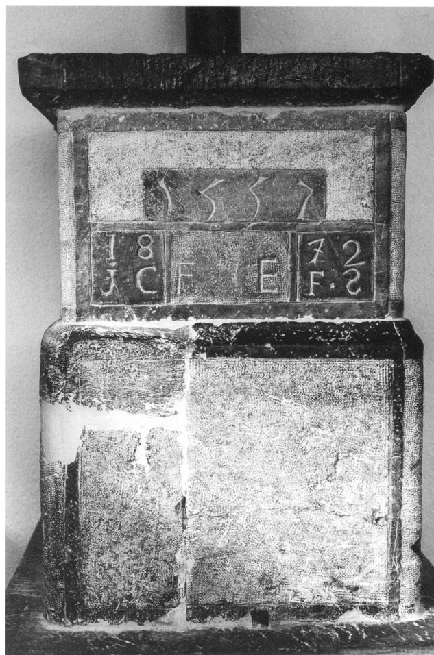
6: Fang VS / Fang d’en Bas. Fourneau en pierre ollaire daté de 1557 – Specksteinofen, datiert 1557.

1383), qui l’utilise comme badge personnel, tout au moins dès 1354. Le nœud apparaît cependant pour la première fois en 1373 sur le sceau du Comte Vert et figure sur ceux de tous ses successeurs jusqu’au duc Louis de Savoie (1413–1465), avant de devenir le badge fami-