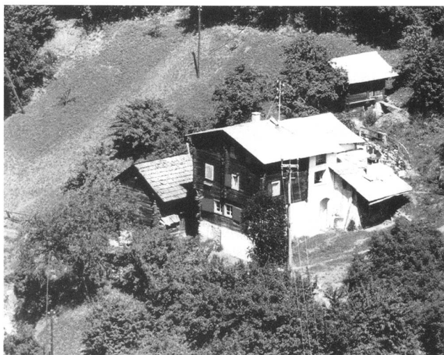
5: Fang VS / Fang du Milieu. Vue aérienne de la maison de Gertrud Frily Zuber – Luftbild von Haus Gertrud Frily Zuber.