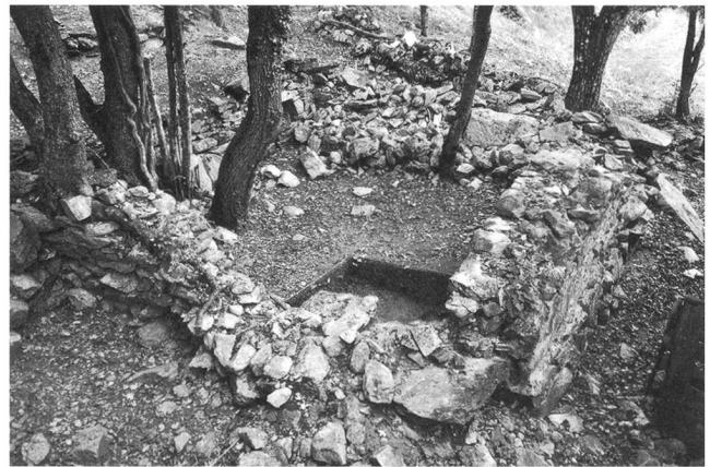
3: Fang VS / Tiébagette. Vue sud-est du bâtiment B8 – Blick von Südosten auf Bau B8.

Saint-Germain-d'Auxerre ne se retrouve guère en Valais que dans le village homonyme, voisin de Rarogne. L'église dédiée au saint n'est autre que la paroissiale primitive du territoire de la famille des Rarognes. 9 Cette dynastie ayant détenu des pouvoirs seigneuriaux dans le Val d'Anniviers entre 1381 et 1467, 10 il est possible qu'une chapelle ait été bâtie à Fang dans cet intervalle. C'est par ailleurs à la même période, soit entre la fin du XIII e siècle et le milieu du XV e siècle, que les édifices chrétiens du Valais adoptent un chœur quadrangulaire.