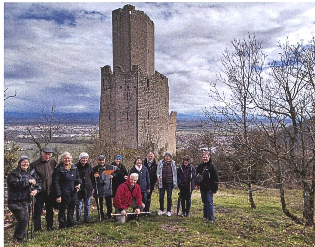
Burgruine Ortenberg.