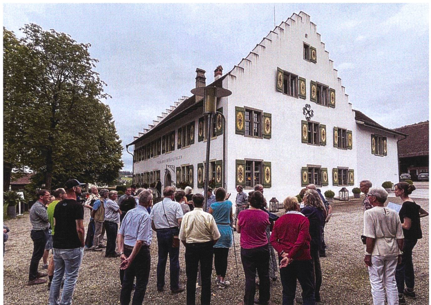
Schloss Wülflingen (Foto D. Gutscher).

Im Anschluss an die Jahresversammlung führte uns Peter Niederhäuser durch die Räume des 1644–1647 erbauten Schlosses Wülflingen, das insbesondere in der Gerichtsstube ein bedeutendes Interieur mit bemaltem Täfer der 1760er-Jahre enthält. Nach einem Glas Wein