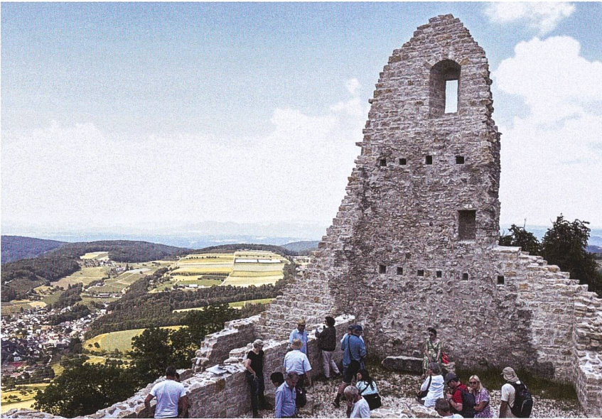
Farnsburg (Foto P. Niederhäuser).

Keeling führte rund 40 Personen durch die Ausstellung mit ihren überraschenden Objekten, während der Museumsvermittler Martin Minder das Alte Zeughaus mit seiner Sammlung vorstellte. Der Nachmittag brachte dann einen Perspektivenwechsel: Der wunderbare Landsitz Waldegg stellt mit den Besenval eine Solothurner Familie vor, die dank französischem Solddienst enormen Reichtum anhäufte und in Waldegg ein Mini-Versailles realisierte.