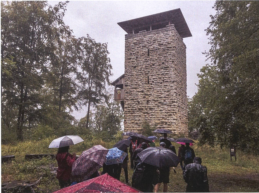
Alt-Wülflingen.