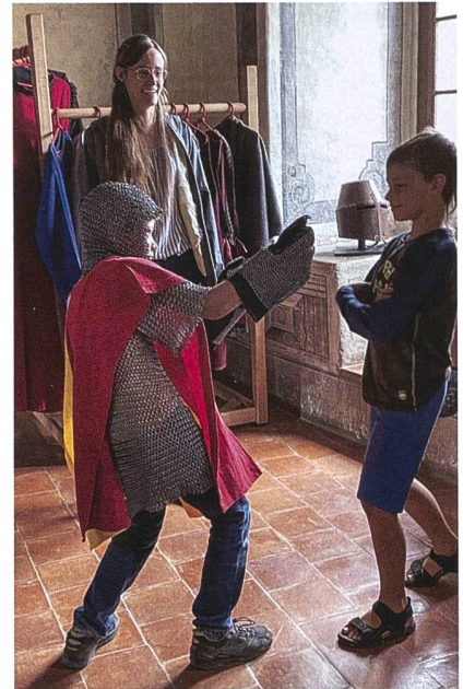
Kinderführung Kyburg.