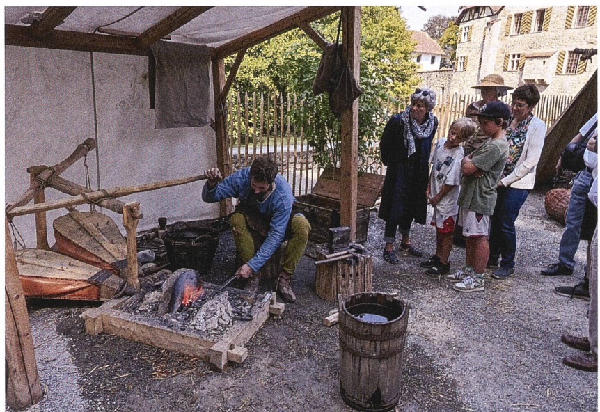
Mittelalterlicher Weiler beim Schloss Hallwyl.

Berichte von Peter Niederhäuser und Jasmin Frei