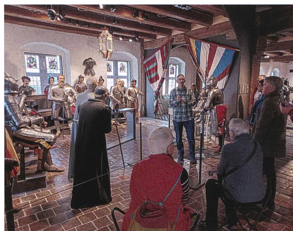
Altes Zeughaus Solothurn (Foto P. Niederhäuser).

Was eigentlich für die Generalversammlung Ende August 2022 geplant war, wurde ein halbes Jahr später nachgeholt – der Besuch der Sonderausstellung «Alarm!» im Alten Zeughaus Solothurn. Ausgehend von einem Nationalfonds-Sonderforschungsprojekt zeigt die Präsentation die vielfältigen Facetten der städtischen Waffenkultur. Die Kuratorin und Berner Professorin Regula Schmid