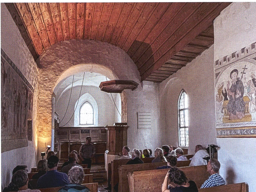
Antoniuskapelle von Waltalingen.