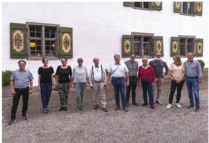
Gruppenbild des Vorstandes.

Hansjörg Frommelt Grosser Bongert 10 FL-9495 Triesen +423 392 15 62 +41 79 433 65 92 hansjoerg@frommelt.li