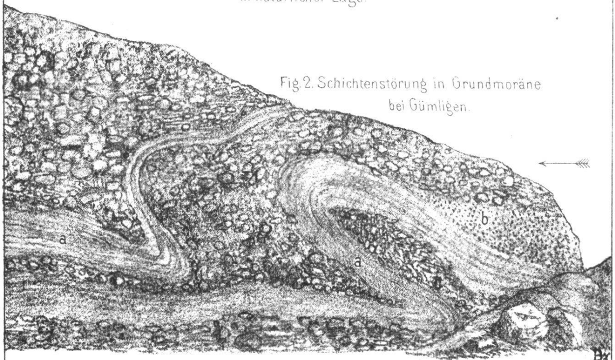
Fig. 2. Schichtenstörung in Grundmoräne bei Gümligen.