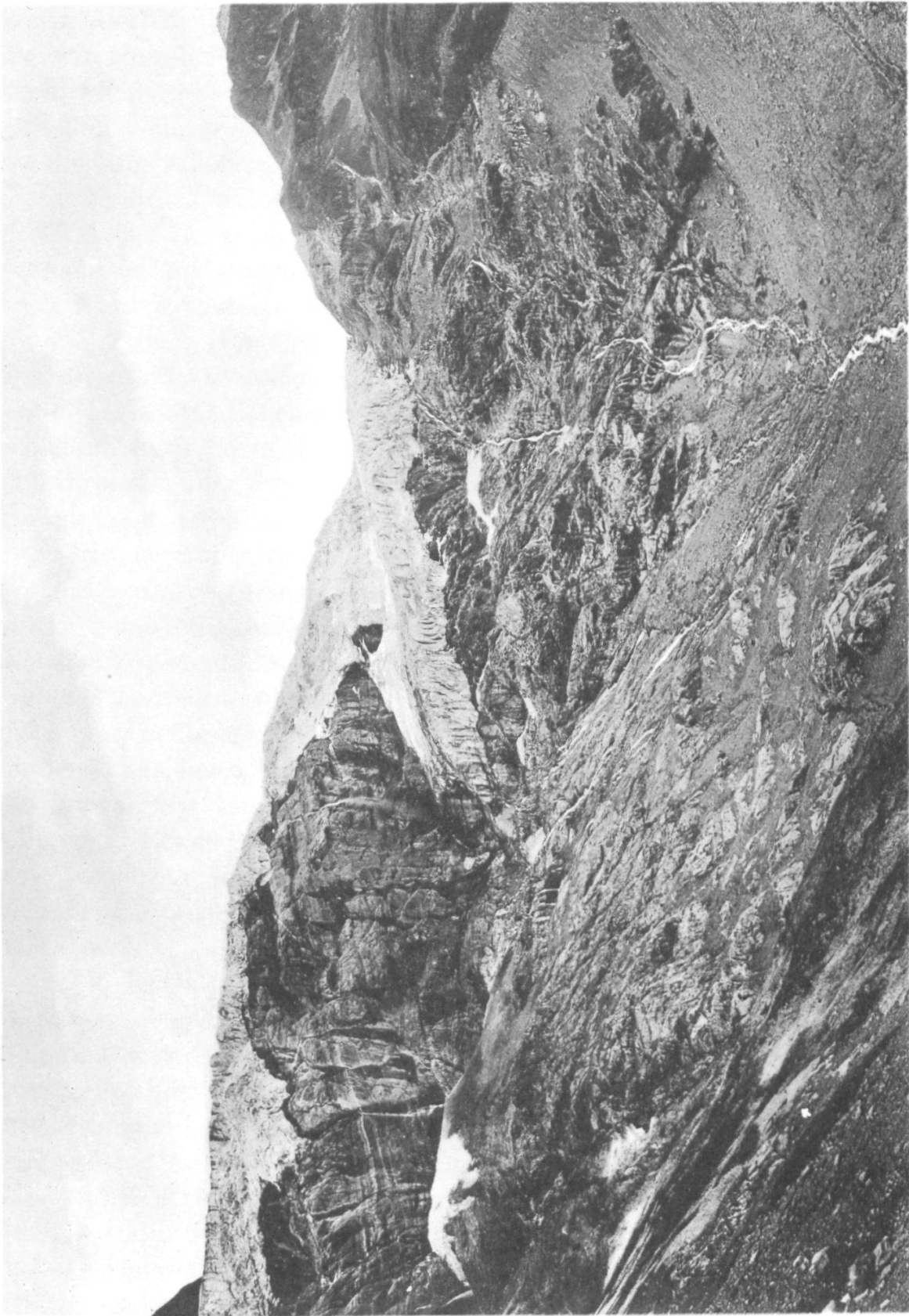
Kontaktzone am Kanderfirnabsturz.