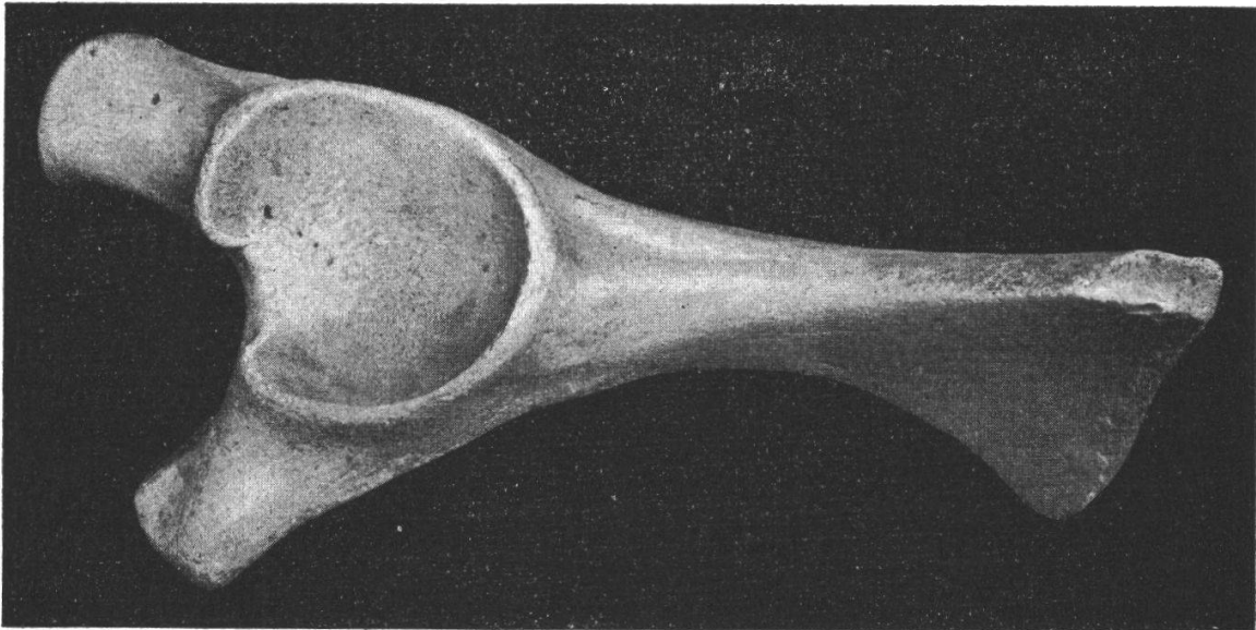
Rechte Beckenhälfte eines Rhinoceros tichorhinus aus Bannwyl. Ansicht von der Aussenseite mit Gelenkgrube.

Die Knochensubstanz ist vorzüglich erhalten, ohne Spur von Verwitterung, die Oberfläche ist glatt, wie geschliffen, die