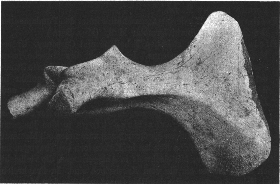
Idem. Ansicht von der Vorderseite, \frac{1}{3} natürl. Grösse.