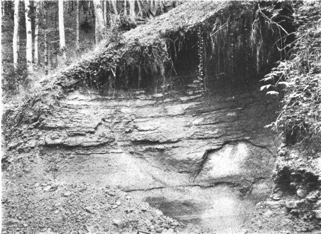
Abb. 2. Hauptansicht.