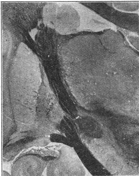
Fig. II. Frontalschnitt durch ein menschliches Gehirn. Man sieht hier an grauen Kernen: längs des linken Randes der Abbildung gewahrt man das Claustrum und nach innen von ihm das Putamen, welches seinerseits dem Globus pallidus von aussen anliegt; unten links erkennt man das Ammonshorn mit dem Alveus und mit der Fimbria fornicis; den ganzen mittleren Teil des rechten Randes nimmt der Thalamus opticus ein, und unter ihm sieht man linkerseits das Corpus Luysii und rechterseits den Nucleus ruber Stillingi; oberhalb des Thalamus befindet sich im Seitenventrikel der Nucleus caudatus.

Wir konstatieren hier einen scheinbaren totalen Durchbruch der Capsula interna durch einen recht breiten Zug grauer Substanz, welche den Globus pallidus direkt mit dem Locus niger verbindet (s. Fig. II).