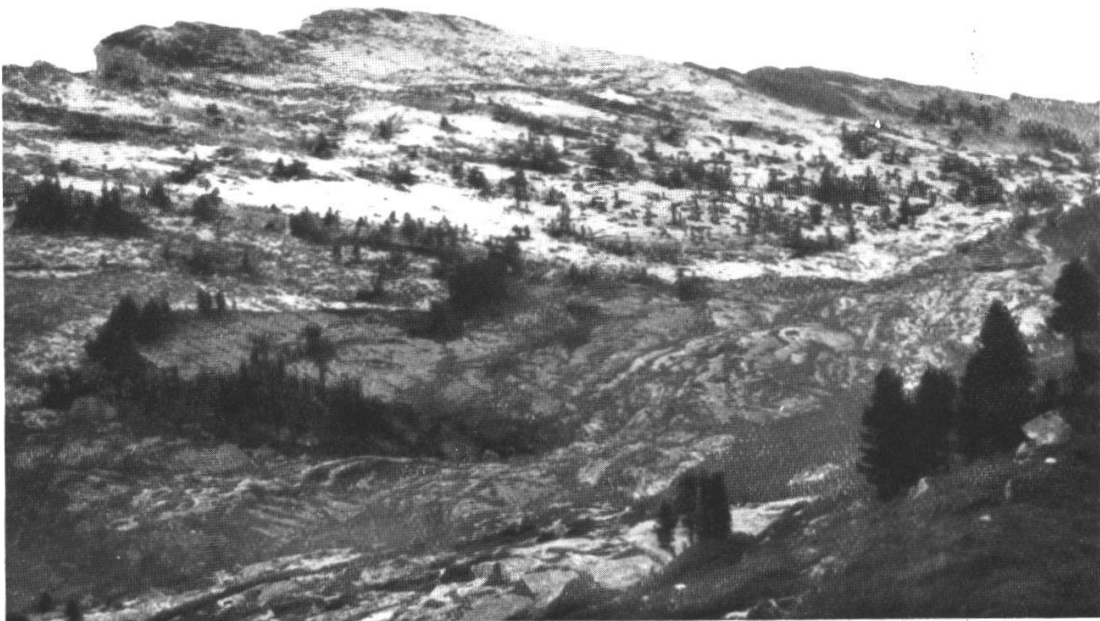
4. Blick vom Grünenberg auf die Sieben Hengste. Schrattenkalk-Hochfläche (Karrenfeld) mit verstreuten Bergföhren und kleinen Rasenflecken. Rechts vorn Alpenrosenbestände auf Hohgantsandstein.