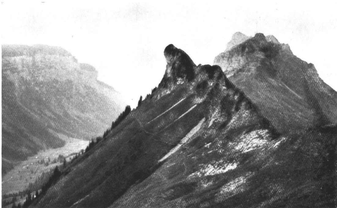
2. Blick vom Burst nach Westen auf die Sigriswilerkette (Hörnlizähne, Vorderes Schafläger und ganz hinten Sigriswilerrothorn). Links das westliche Ende der Gemmenalphornkette (Niederhorn). In der Tiefe das Justistal. Im Hintergrund der Thunersee.