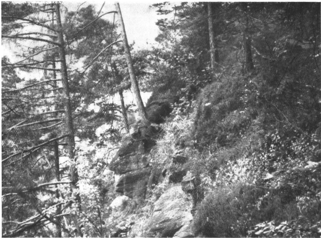
8. Südgeneigter Steilhang über dem Lombach am obern Ende des Thunersees. Bestände der Waldföhre mit reichlichem Gebüsch und Erica-Calluna-Unterwuchs auf Fels von Hohgantsandstein.