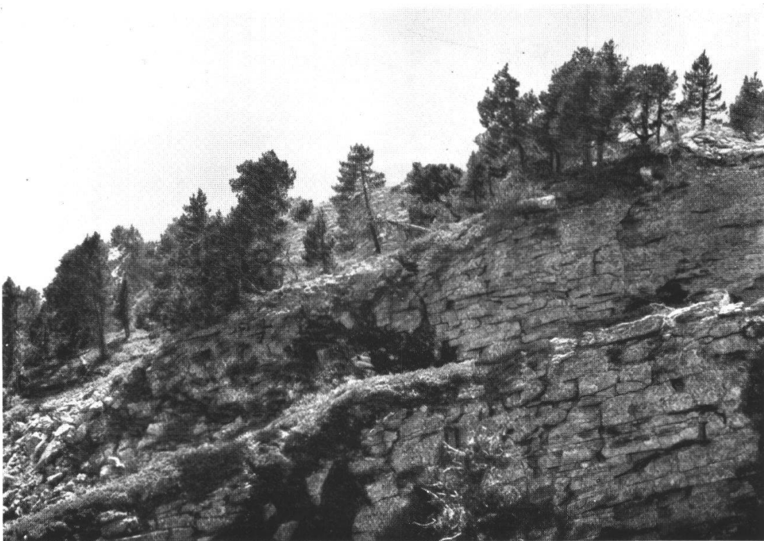
6. Bergföhrenbestände am Hohgant (Steinigematt) auf zerklüftetem Hohgantsandstein.