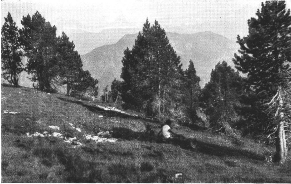
5. Baumgrenze am Hohgant (Steinigematt, 2030 m): Aufrechte Bergföhren (auch Jungpflanzen), Nardus-Rasen, Alpenrosengebüsche.