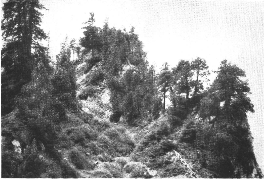
7. Unter Bergli: Aufrechte Bergföhren und einzelne Fichten auf Schrättkalk am Absturz des Sigriswilergrates gegen Nordwesten. In der Mulde und als Unterwuchs Alpenrosengesträuch.