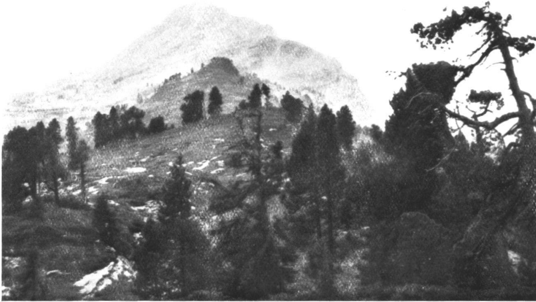
3. Blick vom höchsten Punkt des Grünenberges gegen Westen. Hochfläche des Hohgantsandsteins. Auf den Gräten und Rücken aufrechte Bergföhren mit Alpenrosen-Unterwuchs; in den Mulden Trichophorum-Sümpfen; dazwischen Nardus-Weiderasen. Im Hintergrund das Gemmenalphorn.