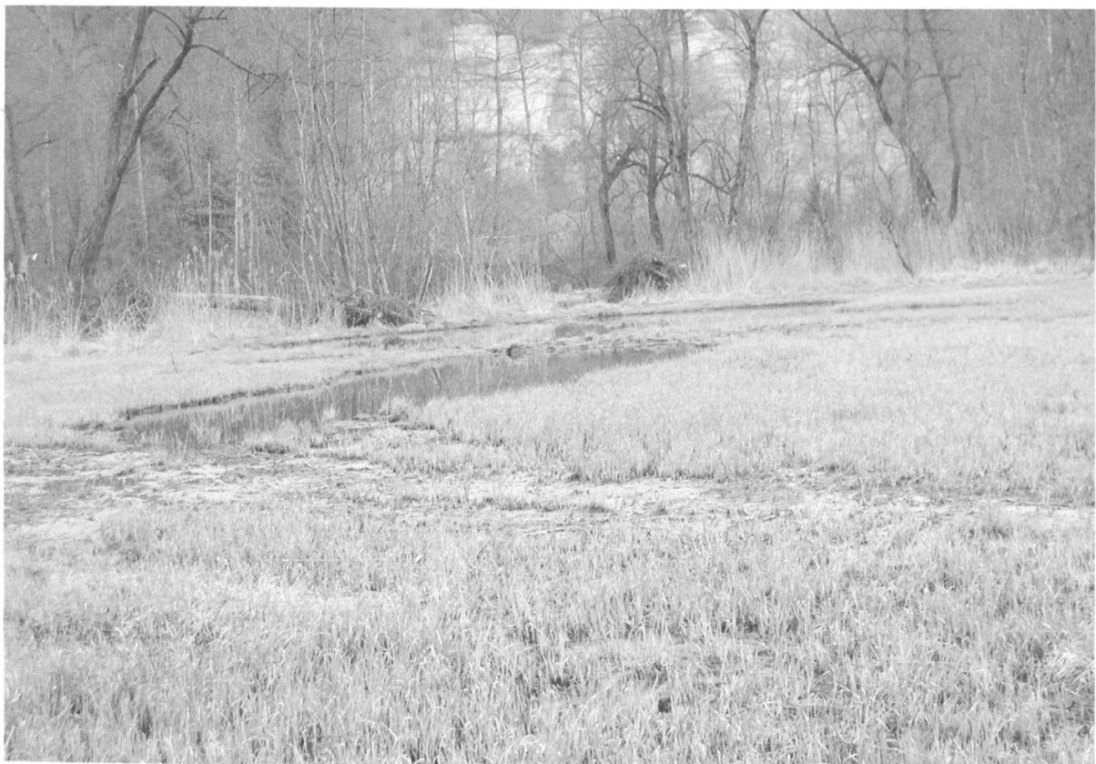
Abbildung 13: Neu erstellte Flachteiche Auried/Oltigenmatt. (Foto W. Frey, April 2003)