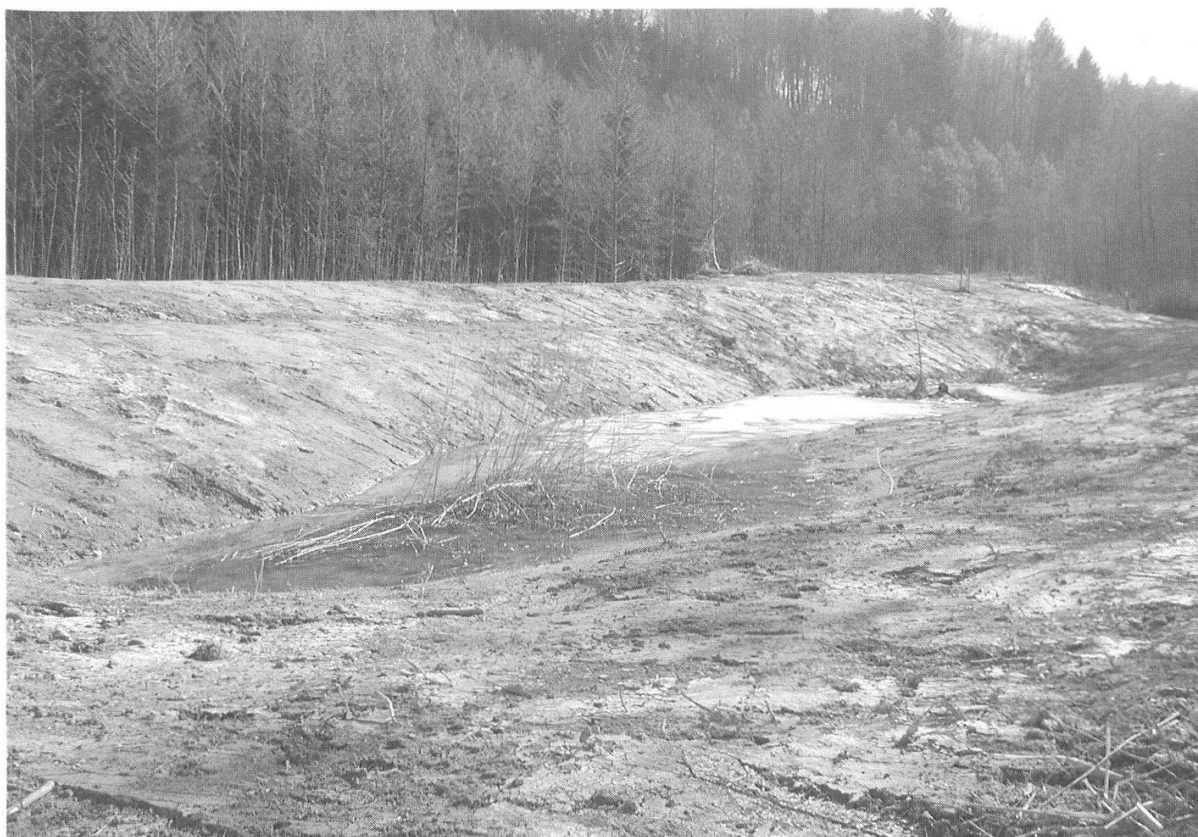
Abbildung 15: Neu geschaffene Rohböden im Längengraben. (Foto Ph. Augustin, März 2003)