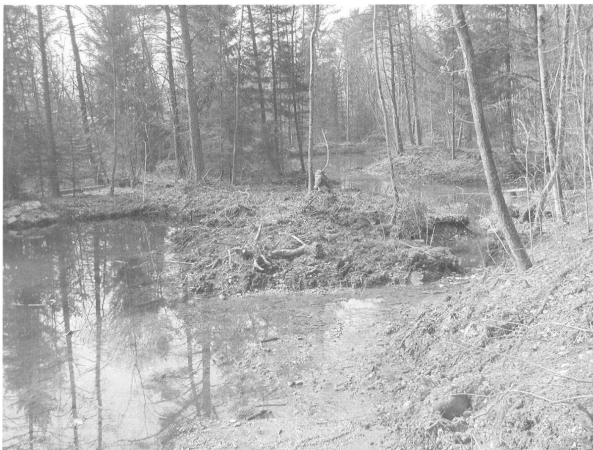
Abbildung 11: Ausschnitt der wieder hergestellten Giessen in den Belperauen.