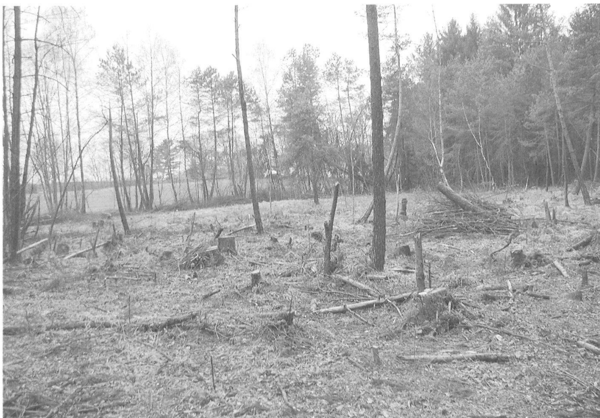
Abbildung 14: Entbuschte Hochmoorfläche im Chlepfibeerimoos. (Foto W. Frey, April 2003)