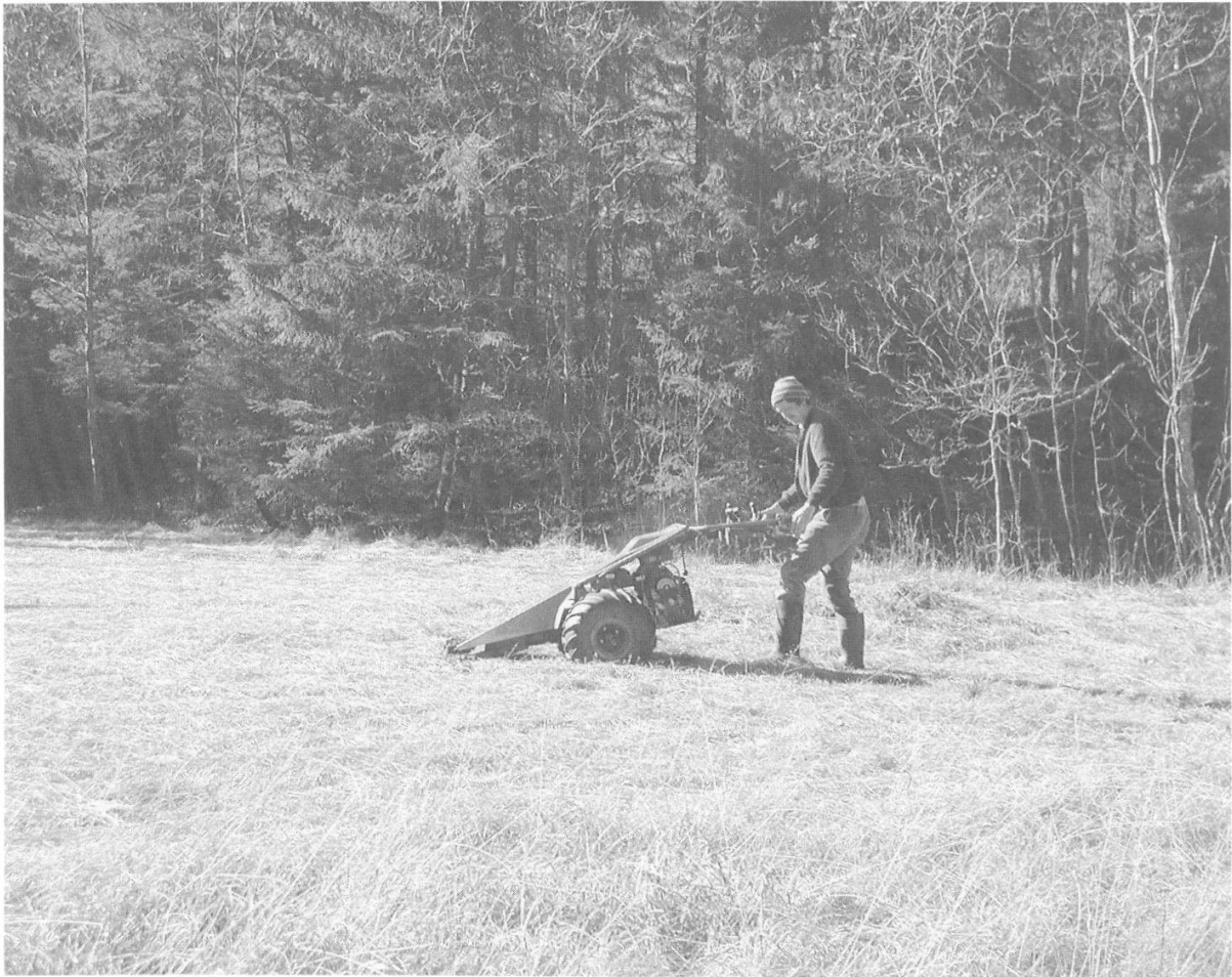
Abbildung 10: Die herbstliche Mahd der Streue ist die wichtigste Massnahme zur Erhaltung der Flachmoore. Schnittzeitpunkt und weitere Auflagen sind in den Bewirtschaftungsverträgen zwischen den Landwirten und dem Naturschutzinspektorat festgelegt.