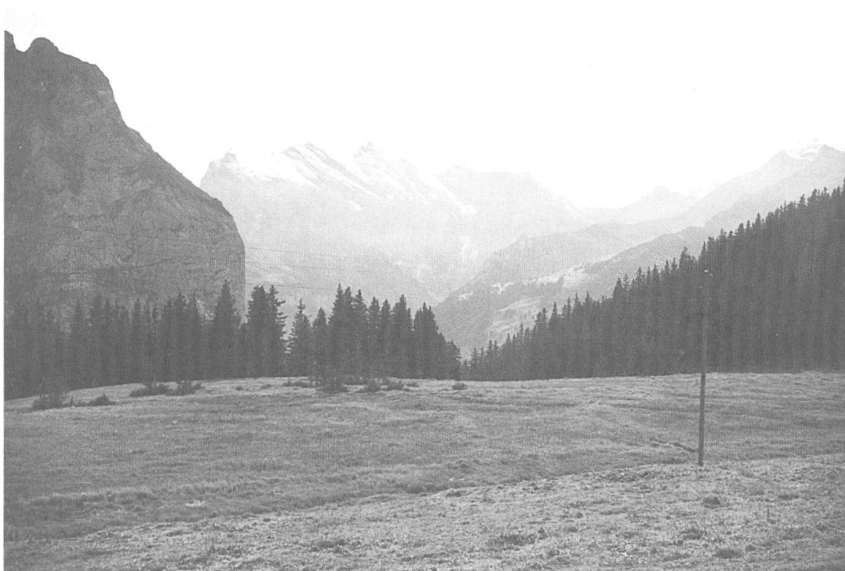
Abbildung 17: Zentralbereich des Naturschutzgebietes Wengernalp mit dem abgezaunten Hochmoorteil. (Foto: R. Keller, 2002)

zu renaturieren. Der Wasserhaushalt im Moor sollte durch den Einbau von 8 Holzsperrren im Graben verbessert werden. Mit Hilfe von zwei Zivildienstleistenden wurden die Arbeiten vorbereitet und die benötigten Bohlen mit Nut und Kamm von der ortsansässigen Sägerei bereitgestellt. Mit dem vor Ort geschlagenen Holz wurde die Holzprügelbrücke erstellt. Mit einem mittelschweren Bagger mit speziell breiten Raupen konnten die Bohlen an den vorgängig festgelegten Orten eingebaut, d.h. in den Boden gedrückt werden. Das vom früheren Grabenaushub stammende Material diente als Grabenfüllmaterial vor und hinter den Holzsperrren (Abb. 18). Bereits nach dem ersten Regenfall sammelte sich das Wasser im renaturierten Gebiet an. Mit dieser Sofortmassnahme konnten die hydrologischen Verhältnisse im Moor verbessert werden. Wir erwarten nun wieder ein Wachstum der Torfmoose im Kern des Hochmoores. Periodisch sollen die Vegetation überprüft und Veränderungen festgehalten werden.