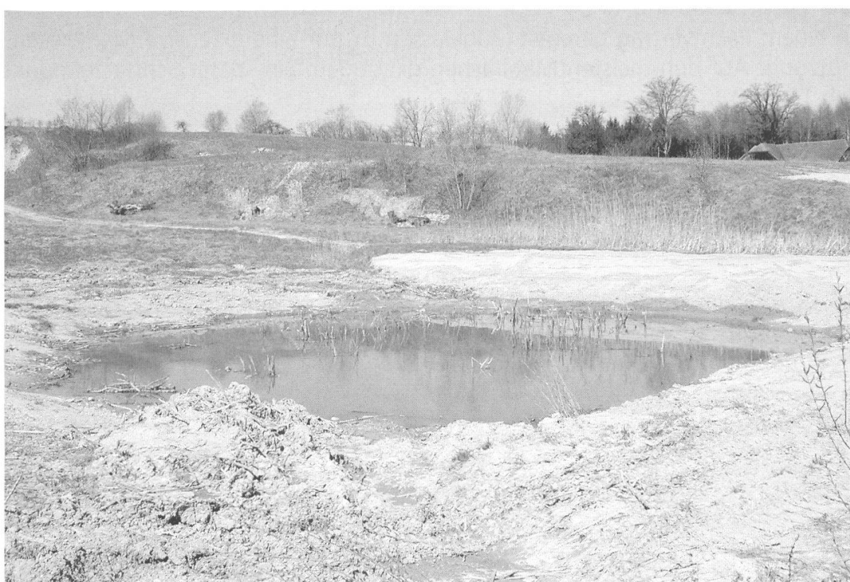
Abbildungen 6 und 7: Chnuchelhusgrube. Gruben sind wichtige Sekundärlebensräume für ursprünglich in Auenlandschaften beheimatete Pionierarten. Die erneuernde Dynamik der Hochwasser fehlt jedoch. Mit Trax und Bagger werden Teilbereiche periodisch in ein Initialstadium zurückversetzt.