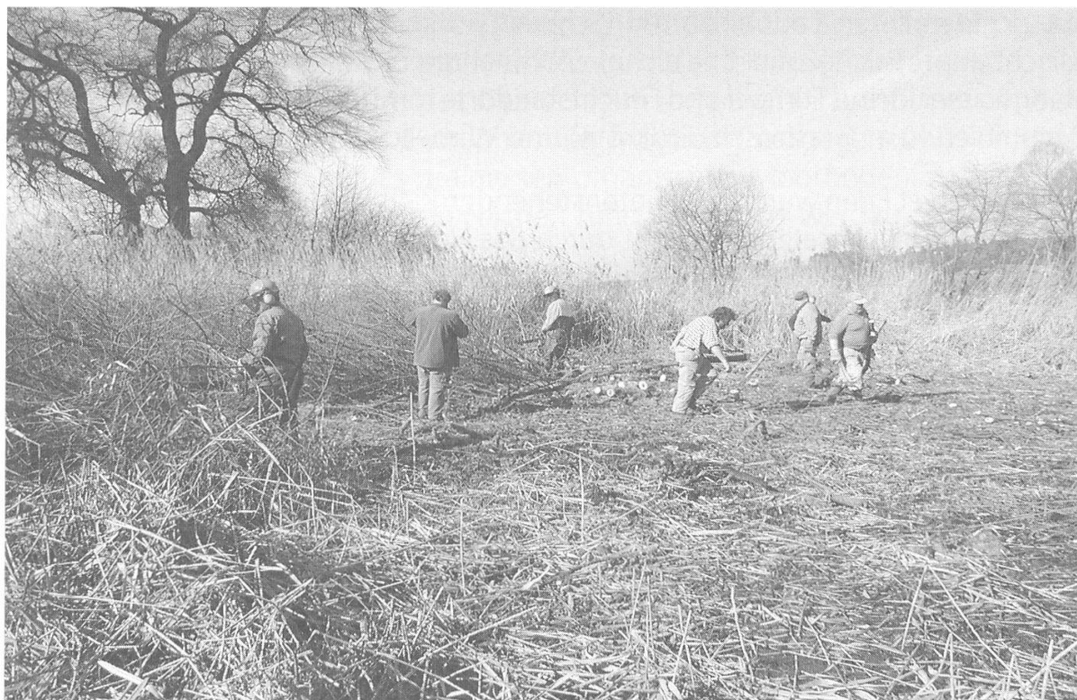
Abbildung 3: Freiwillige Helfer im Wengimoos in Aktion. (Foto Ph. Augustin, März 2003)

und Filfalle (Kandersteg) erarbeitet. Exemplarisch sollen hier fünf Gebiete, welche die Lebensraumtypen «Laubmischwald», «Kleinsee», «Pionierstandort», «mittelländische Agrarlandschaft» und «voralpines Hochmoor» repräsentieren, vorgestellt werden: