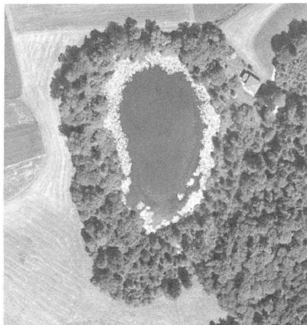
Abbildung 4: Orthofoto des Geistsees. Die Ufer sind heute durchgehend bewaldet.

EMCH UND BERGER AG (2003): Naturschutzgebiet Geistsee, Kurzbericht Pflegeplanung, unveröffentlichter Bericht, erstellt im Auftrag des Naturschutzinspektorates des Kantons Bern.