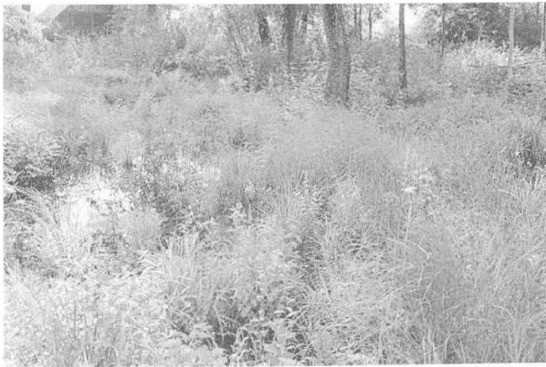
Abbildung 5: Durch Auslichten und Entbuschen soll die Moorvegetation gefördert werden.