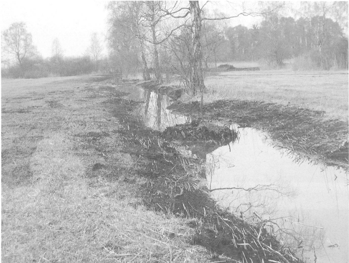
Abbildung 16: Aufgewerteter, ehemals verlandeter Graben im Ziegelmoos. (Foto W. Frey, April 2003)