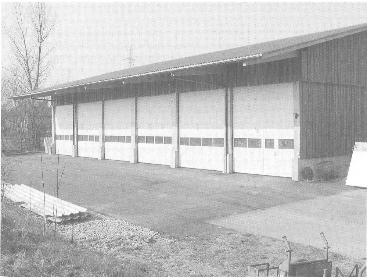
Abbildung 19: Neu erstellte Werkhalle. (Foto W. Frey, April 2003)

und Werkräume des Tiefbauamtes benützen. Gewisse Maschinen können gemeinsam genutzt werden, da beim Naturschutzinspektorat die Mäh- und Pflegearbeiten vor allem im Winter anfallen, andererseits die Unterhaltsarbeiten an den Strassenböschungen beim Tiefbauamt vorwiegend im Sommerhalbjahr erledigt werden. Daraus ergibt sich eine wesentlich bessere Auslastung der Maschinen, was sich auch positiv auf die Kosten auswirkt. Kleinere Reparaturen an unsern Maschinen können zudem kostengünstig durch Fachleute des Tiefbauamtes ausgeführt werden. Alles in allem kann dies als gutes Beispiel einer direktions- und amtsübergreifenden Zusammenarbeit aufgeführt werden (betroffen sind zwei Direktionen und drei Ämter).