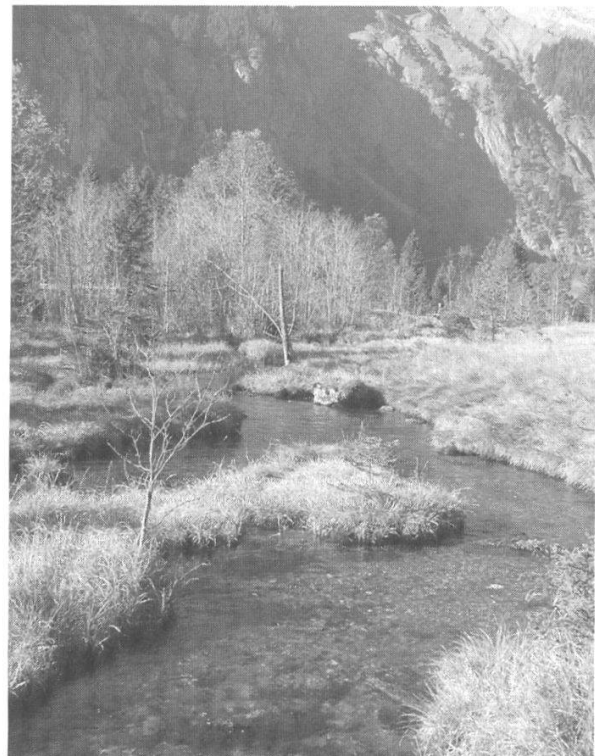
Abbildungen 8 und 9: Flachmoore und natürliche Quellbäche sind charakteristisch für das Naturschutzgebiet Filfalle.