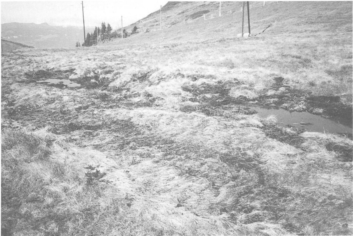
Abbildung 18: Renaturierte Kernzone des Hochmoores mit verbesserten hydrologischen Verhältnissen. Das Hochmoorwachstum kann nun wieder einsetzen!