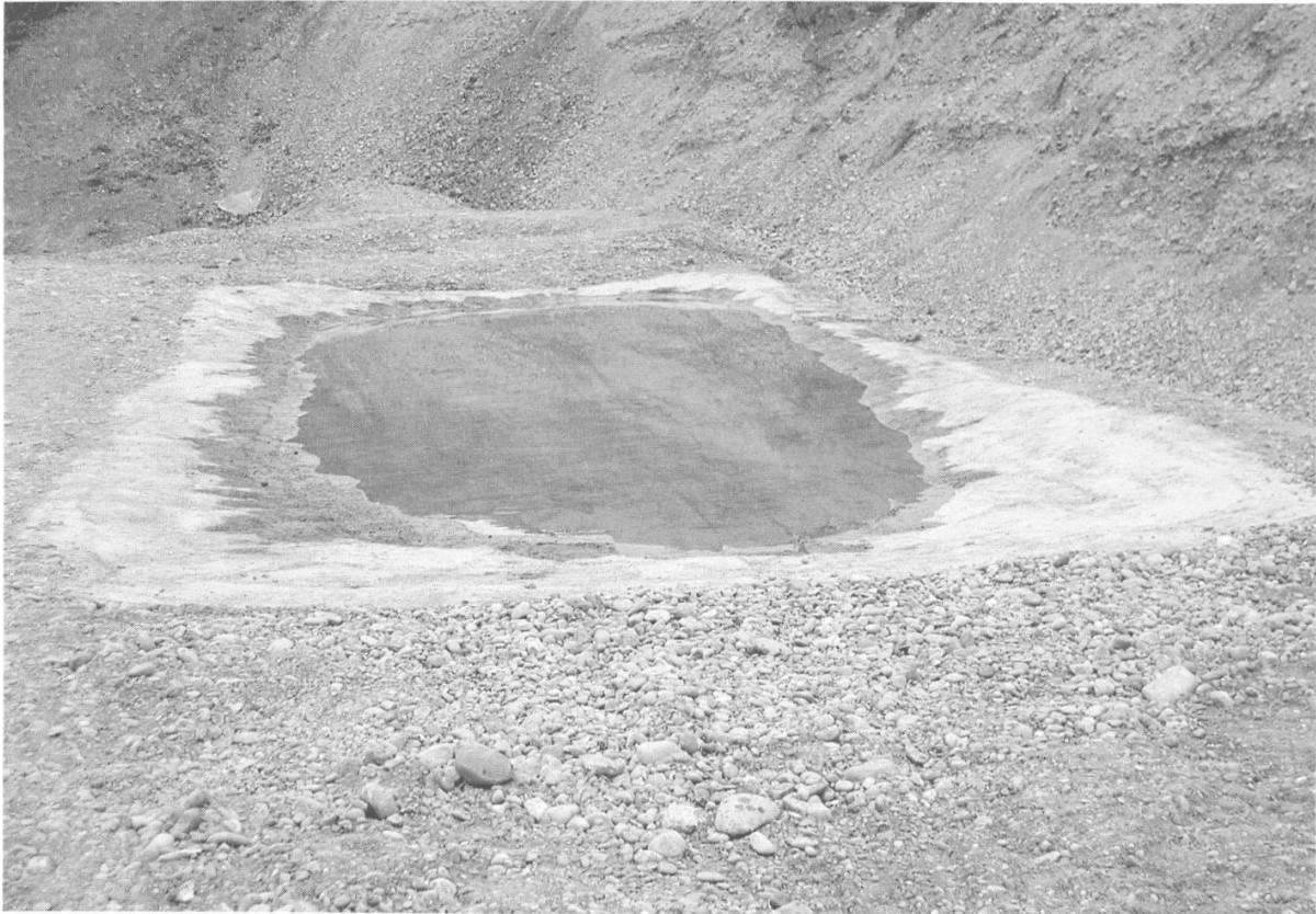
Abbildung 12: Betonierter Teich in der alten Kiesgrube Bühl. (Foto W. Frey, April 2003)