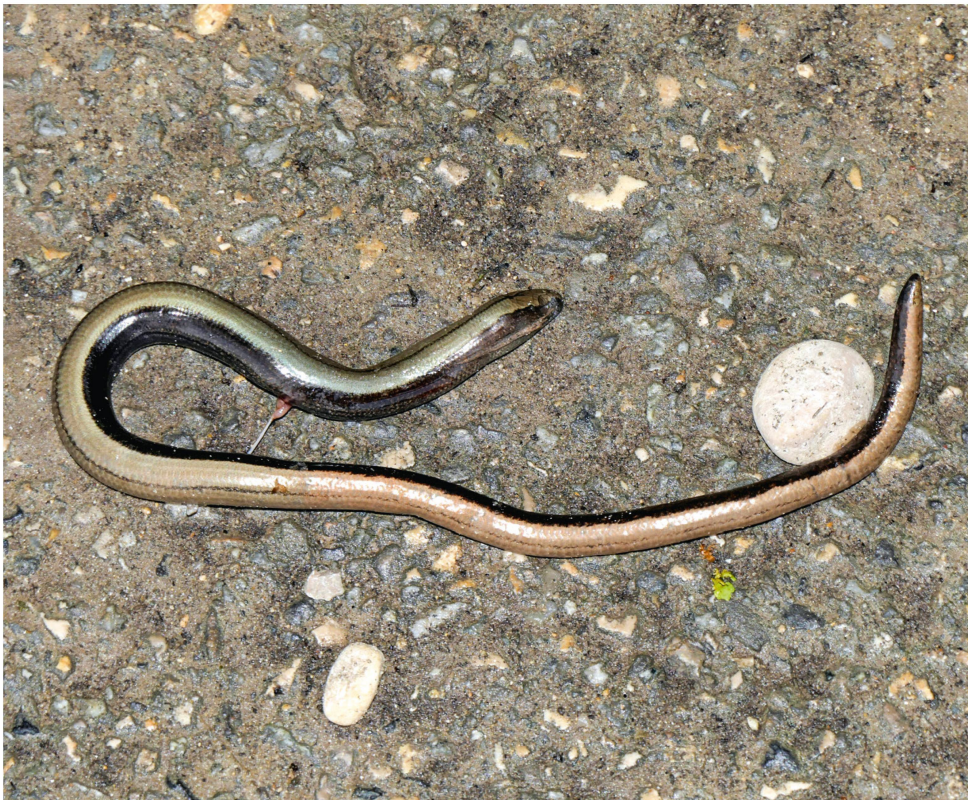
Abb. 11: Die Westliche Blindschleiche, ein häufiges und weitverbreitetes Reptil in der Schweiz und ganz Mitteleuropa, konnten wir nur einmal als totes Jungtier bei Yverdon-les-Bains bestätigen.

Die Zauneidechse ist in der Nord- und Westschweiz weit verbreitet und besiedelt auch die Täler von Inn (En), Vorderrhein und Rhone. Sogar im Tessin gibt es neuerdings einen Fund (von 2021: SZKF/CSCF 2022). Hinsichtlich ihrer Grösse steht sie zwischen der schlanken, flach gebauten Mauereidechse und der kräftigeren Smaragdeidechse. Sie ist im südlichen Mitteleuropa, also auch in der Schweiz, ein Ubiquist, wie HOFER ET AL. (2001) betonen. So besiedle kein anderes heimisches Reptil ein vergleichbar breites Lebensraumspektrum von Mooren über Feuchtwiesen und Auwälder bis hin zu Schutthalden, wenngleich immerhin eine Präferenz für südexponierte Saumbiotope feststellbar sei. Bedeutend für L. agilis sind überdies Sekundärbiotope wie naturnahe Gärten, Bahnanlagen und aufgegebene Industrieflächen (BLANKE 1999, HOFER ET AL. 2001). Überall wichtig sind grabfähige Böden zur Eiablage (GLANDT 2018). Die Rote Liste führt die Zauneidechse als «verletzlich» und vermerkt überdies einen «gene-