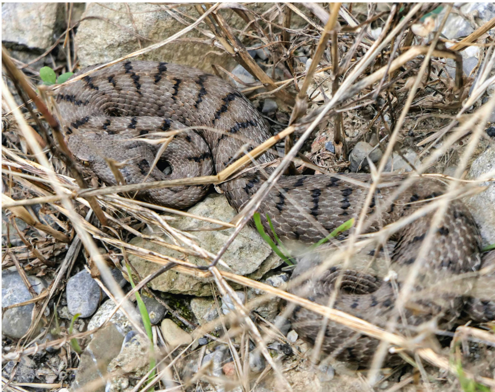
Abb. 6: Adulte Aspispiper in den Weinbergen des Lavaux.

Schwerpunkte der Verbreitung von V. aspis sind Frankreich (bis fast an die Luxemburger Grenze), die Schweiz und Italien. Selbst im äussersten Südwesten Deutschlands (Südschwarzwald) ist diese Art vertreten, wenn auch sehr selten und vom Aussterben bedroht (GLANDT 2018). In der Schweiz ist sie dagegen relativ weit verbreitet, konzentriert sich dabei auf den Jura im Westen, auf den südlichen Kanton Bern, das Wallis und auf das Tessin (HOFER ET AL. 2001). Im Schweizer Mittelland fehlt die Art weitgehend, vom südlichsten Part am Genfer See abgesehen.