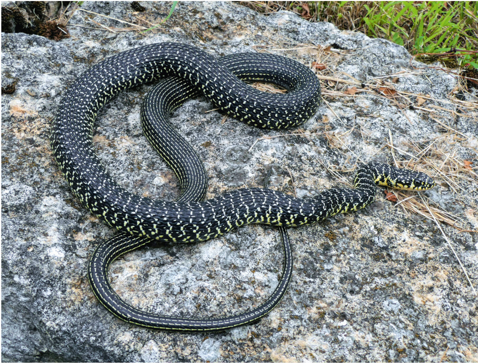
Abb. 8: Gelbgrüne Zornnatter auf einer Weinbergsmauer bei Onnens/Bonnevillars (am Neuenburger See); die eindrucksvolle Schlange war etwa 130 cm lang.