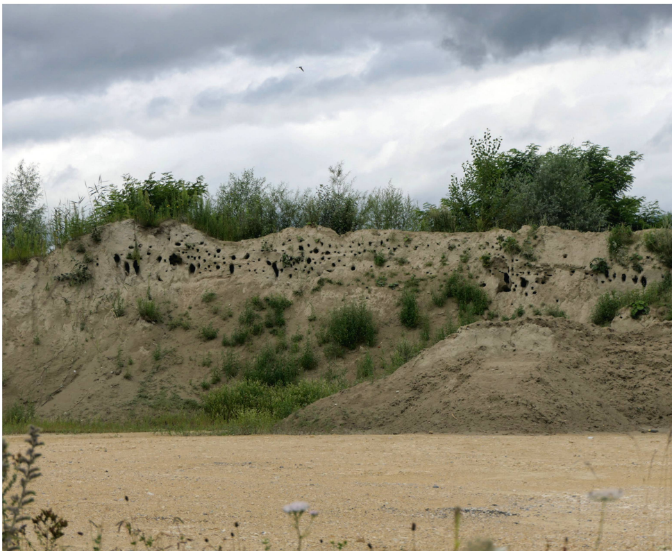
Abb. 13: Brutkolonie (Bruttröhren) der Uferschwalbe an einer Aufschüttung bei Grandson.

In den Weinbergen des Lavaux bei Grandvaux beeindruckte uns nachmittags ein Rotfuchs, der es fertigbrachte, bei unserem Anblick mit einigem Gepolter über eine mannshohe Mauer am Wegrand zu setzen. Vollkommen überrascht waren wir ausserdem über zwei Gämsen, Geiss und Kitz, im «Stadtwald» von Fribourg oberhalb der Beatuskapelle am Galterntal. Erwähnenswert ist zudem der nächtliche Fund einer männlichen Kräuseljagdspinne ( Zoropsis spinimana , Abb. 14) auf einer Hauswand unweit des Fribourger Kathedrale und die Beobachtung der Springspinne Icius subinermis (Weibchen) auf einem Obstbaum bei Grandson.