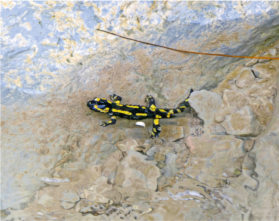
Abb. 3: Feuersalamander in einem Kolk des Champafion oberhalb von Riex (Lavaux).