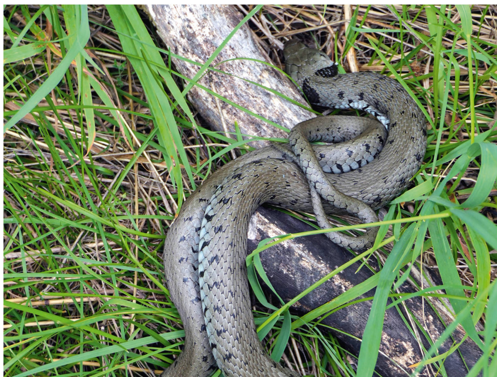
Abb. 7: Grosses, gut 100 cm langes Weibchen der Barren-Ringelnatter auf einer Wiese im oberen Bereich des Tals der Saane (Sarine) bei Pierrafortscha/Fribourg.

Den Verfassern des vorliegenden Textes glückten zwei Sichtungen von Schweizer Barrenringelnattern: Am 26.7. auf dem Gebiet der Gemeinde Pierrafortscha vor den Toren Fribourgs, das grosse, etwa 110 cm lange Weibchen lag vor einem Heckenstrei-