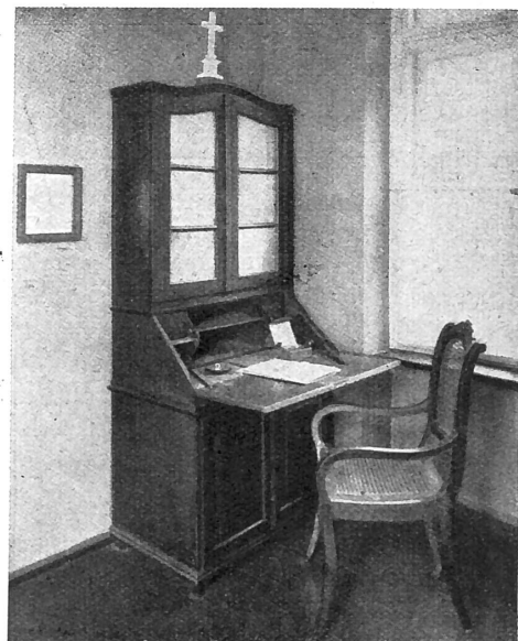
La table de travail de Raiffeisen (conservée au musée Raiffeisen).

A la suite des pertes subies avec la Parqueterie de Bassecourt et lors d'assainissements agricoles, cet établissement local, vieux de 73 ans, a dû procéder à une réorganisation. Lors de l'assemblée générale des actionnaires du 20 avril dernier le capital-actions a été réduit de Fr. 1,5 millions à Francs 750.000 et porté ensuite de nouveau à Fr. 1 million par l'émission de francs 250.000. — de nouvelles actions. Le gérant a été relevé de ses fonctions. Le Conseil d'administration n'a également pas reçu de fleurs ! Il y a eu 6 démissions. De 11 il en reste 5. Les gras tantièmes ont été supprimés.