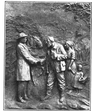
« L'aide personnelle ».

Dieu soit loué, il s'est trouvé dans notre pays de ces hommes de cœur et de dévouement pour réaliser les nobles idées du grand philanthrope. Et aujourd'hui plus de 6000 membres des comités travaillent et se dévouent dans les Caisses locales sans aucune rétribution. Les meilleurs et les plus nobles natures sont gagnées à la cause. Les entreprises économiques et financières fondées sur le matérialisme naissent et disparaissent. Immuables sont par contre les organisations Raiffeisen parce qu'elles sont basées sur les principes chrétiens de l'amour du prochain et de l'entraide. La communauté raiffeiseniste suisse honore aujourd'hui avec des sentiments d'amour et de reconnaissance la mémoire du grand philanthrope et renouvelle son serment de fidélité à son idéal : christianiser l'épargne et le crédit,