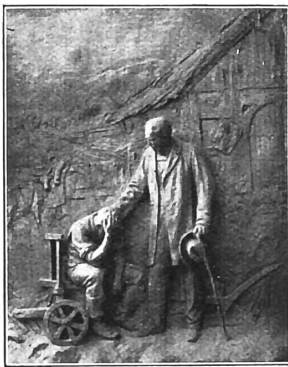
« L'amour du prochain ».

Voici de quel esprit surnaturel il voulait que soient animés les ouvriers des œuvres sociales : « On entend souvent dire : Qu'est-ce que j'en ai de me dévouer ainsi ; des remerciements on n'en a point, on ne récolte que de l'ingratitude, etc. De telles plaintes se comprennent de la part de ceux qui ne travaillent que pour les hommes. Mais, dit le Sauveur, ce que vous aurez fait au plus petit d'entre les miens, c'est à moi que