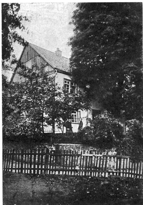
La maison natale de Raiffeisen.

Vers 4 heures, les deux bateaux regagnent Neuchâtel, puis c'est la dislocation. Le quatrième congrès en Suisse romande a vécu. Plus que tout autre jusqu'ici il s'est déroulé dans une atmosphère de cordialité et de joie. Il laissera à tous ceux qui eurent le privilège d'y participer un excellent souvenir.