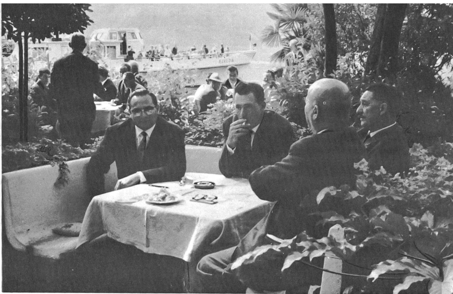
Al primo tavolo i delegati della Cassa di Val Colla e di quella di Sonvico.

Pure ho notato con piacere, durante le frequenti visite a casse, come i dirigenti si siano formati una più profonda coscienza Raiffeisen: si sa rispondere negativamente a smisurate o sbalate richieste di mutuo e meglio comprendere che l'Unione non sempre può fare miracoli con anticipi.