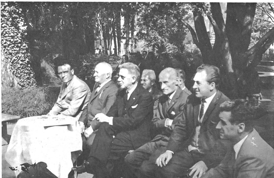
In primo piano i delegati della Cassa di Pazzallo e di quella di Montagnola.

E mi sia permesso aggiungere un'altra considerazione: collaborando all'andamento delle casse rurali, voi assumete volontariamente una corresponsabilità per il benessere vostro e della popolazione nei vostri comuni. Anche così voi rendete un grande servizio, che si contrappone ad un pericoloso fenomeno. Oggigiorno la gente si sottrae sempre più alla responsabilità. Nel settore economico, politico e sociale vi è sempre più la tendenza a lasciare la re-