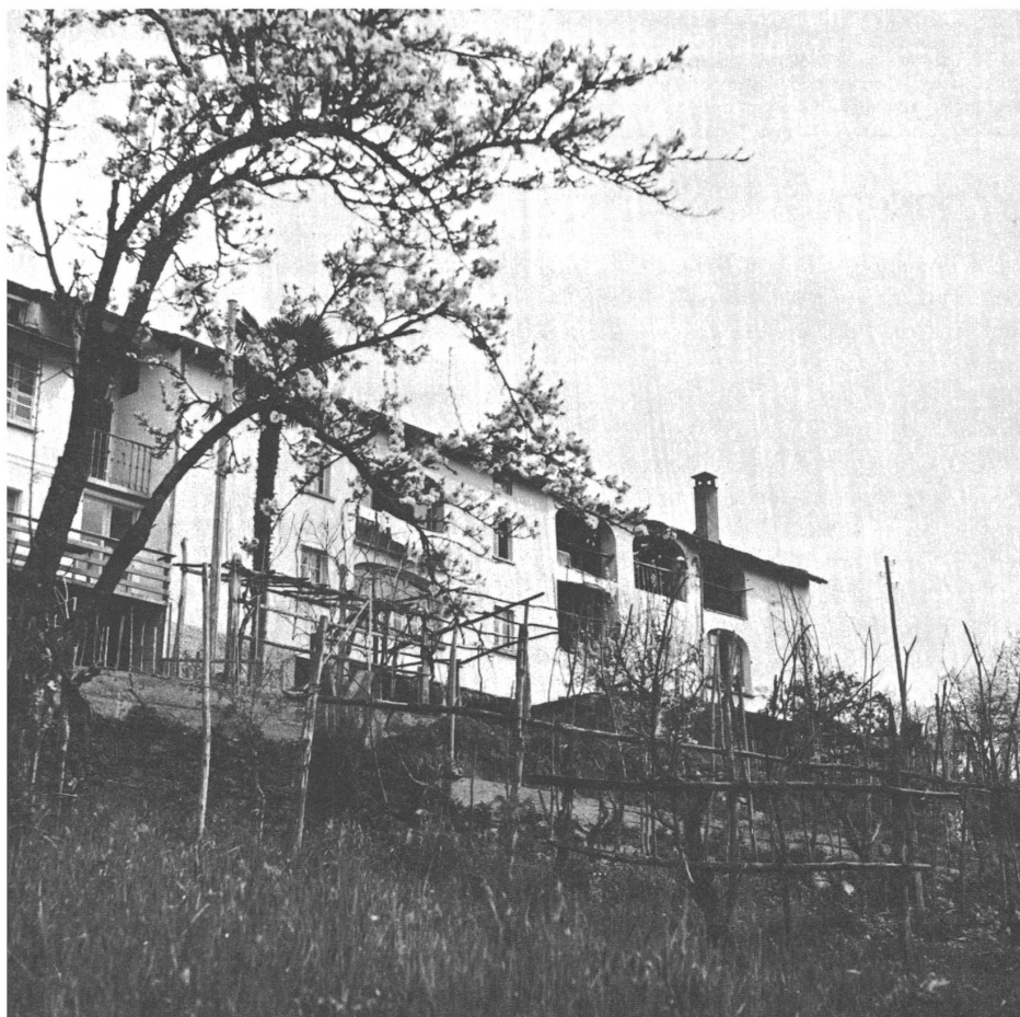
Lopagno, in Valle Capriasca

E qui, giù la sua brava frascata, anzi due se possibile, sul malandrino colto in flagrante a «rubare» quello là, proprio quello che lui, il Pedru, aveva gelosamente seminato sotto il tavolo nell'intento di garantirsi una piccola preziosa riserva, in-