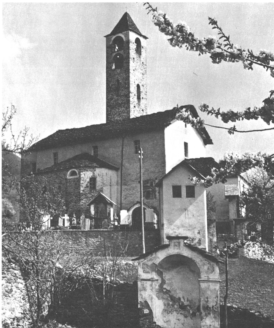
La Chiesa di Rossura

L'analisi di mercato, che comprende moltissimi altri particolari, è indubbiamente molto interessante e preziosa, in quanto ci aiuta a meglio indirizzare l'attività futura delle casse rurali. Riteniamo, in particolare, che essa evidenzi l'importanza di far meglio conoscere al vasto pubblico, nella giusta luce, le casse rurali, e di estendere — com'è allo studio — l'entità dei suoi servizi a favore dei soci e della clientela.