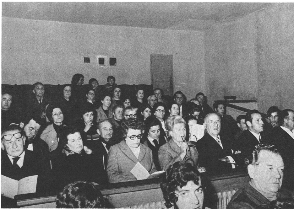
Pur avendo lasciato agli uomini i posti in prima fila, le donne hanno dimostrato — con 25 adesioni in qualità di socio sul totale di 71 — il loro deciso interessamento alla nuova istituzione locale.

In primo piano alcuni dei dinamici promotori della Cassa Rurale di Croglio.