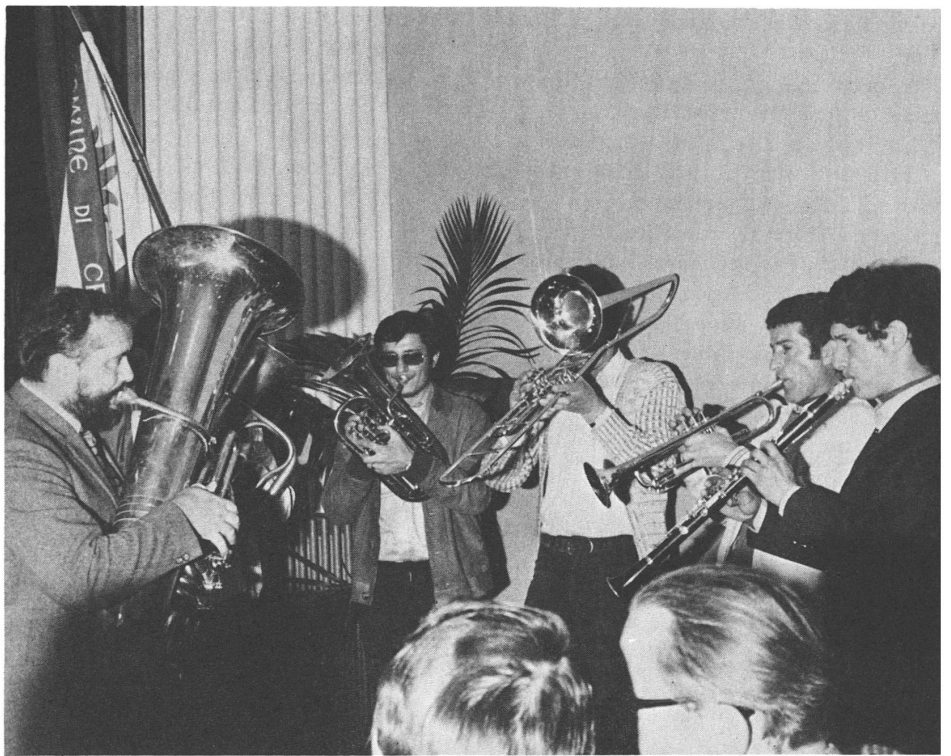
Le note della «Bandella» hanno fatto da allegro preludio all'assemblea costitutiva della 100.a cassa rurale ticinese.