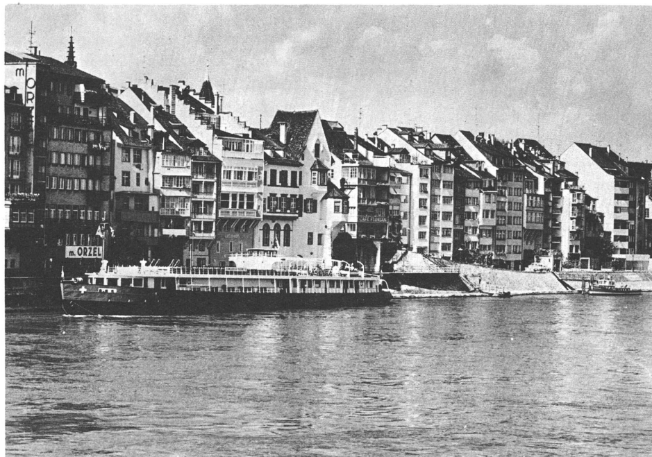
Motivo a Basilea, dove il 10 e 11 giugno converranno i delegati delle casse rurali svizzere per l'annuale assemblea.

Le odierne ed evidenti sperequazioni economiche e sociali forniscono, a taluni, argomenti più o meno fondati per avanzare proposte di nuovi assetti in ordine all'organizzazione dei rapporti economici, tentando di rivolgere il regime della proprietà