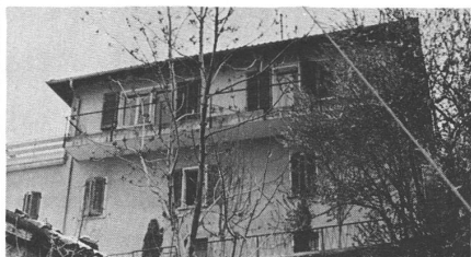
A Bogno (Valcolla), a 20 km da Lugano in zona tranquilla e soleggiata