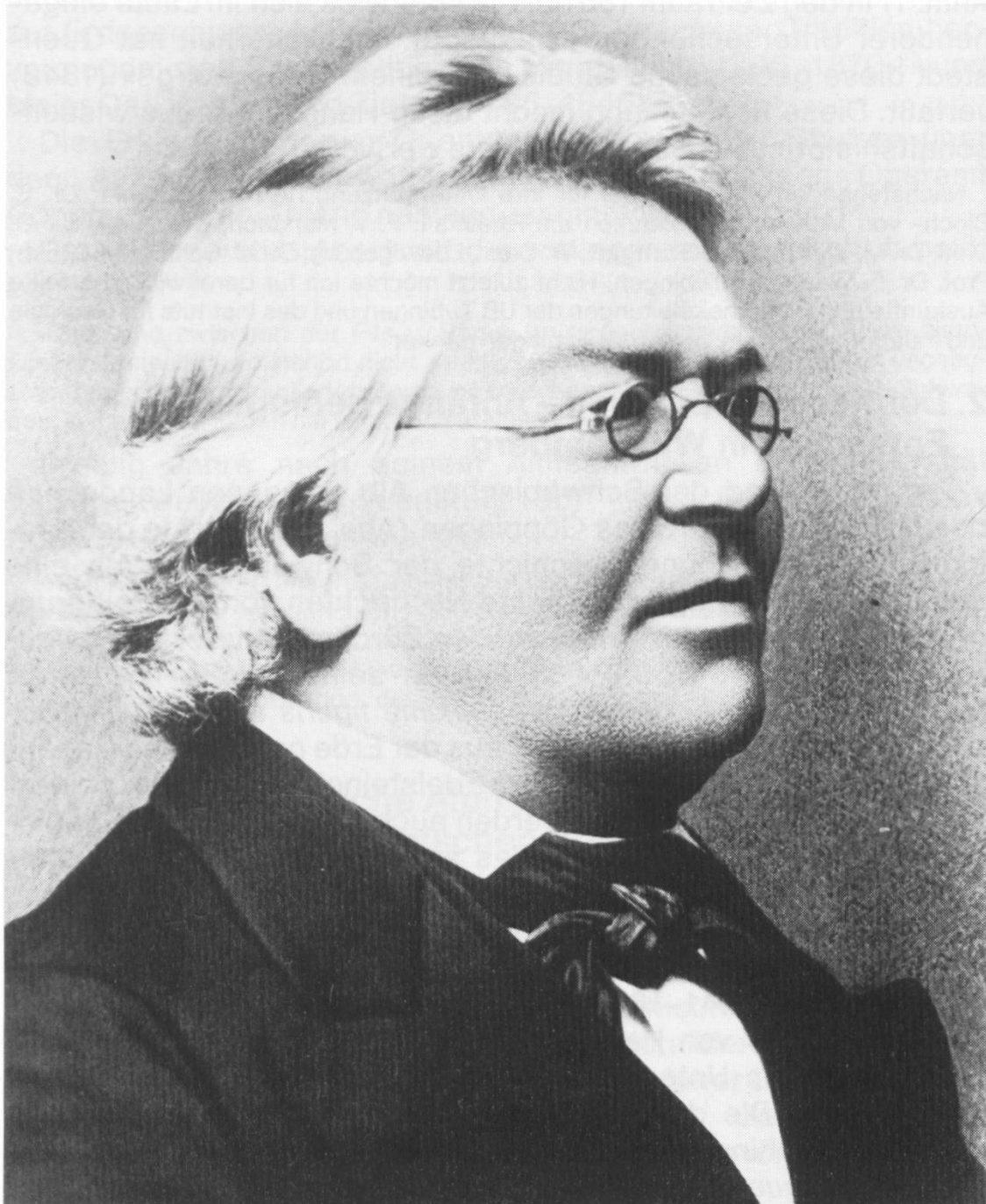
Abb. 1: Friedrich August Quenstedt (1809–1889)

Die vorliegende Publikation zum 100. Todestag von Friedrich August Quenstedt (Abb. 1) soll zur Entstehungsgeschichte dieses «Quenstedt-Alphabets» beitragen.