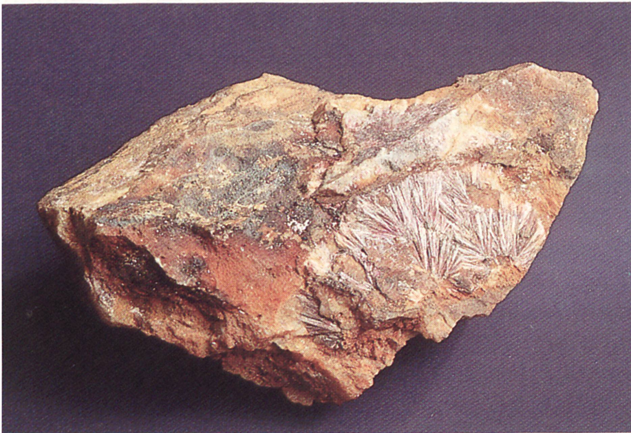
Kobaltblüte (Erythrin) «Weißer Hirsch» – Fundgrube bei Schneeberg