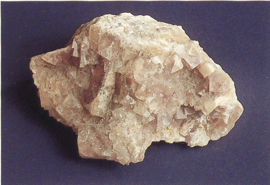
Fluorit Churprinz Friedrich August – Erbstollen, Großschirma