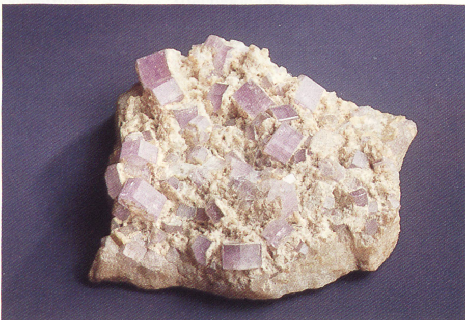
Apatit mit Quarz überdrust auf dem Zinnstein- gang des Morgen- röther Zuges bei Ehrenfriedersdorf