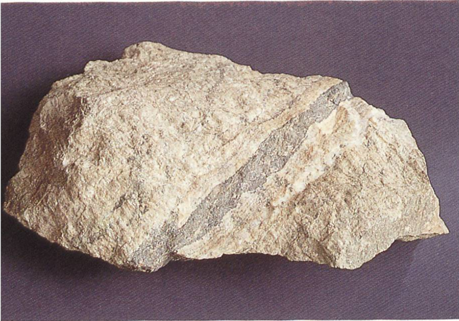
Edle Braunspat- formation «Himmelsfürst» – Fundgrube bei Freiberg