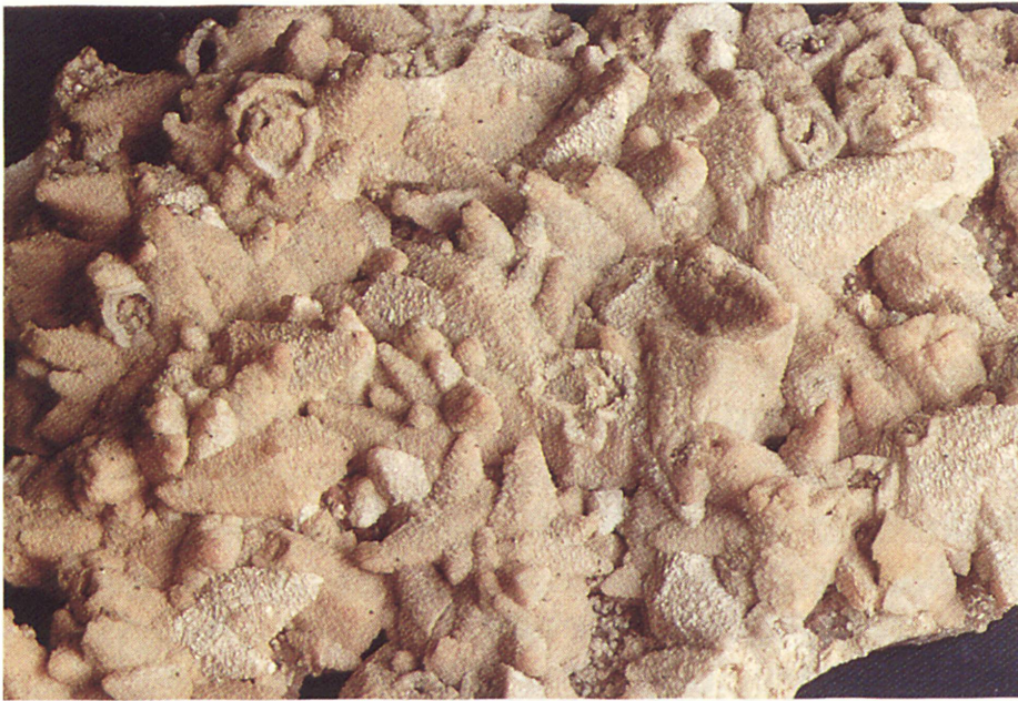
Braunspat in Pseudomorphosen nach Kalkspat David – Richt- schacht bei Freiberg