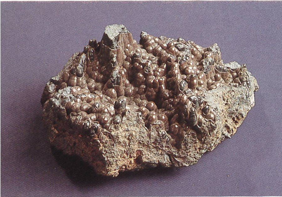
Psilomelan (Hartmanganerz) Grube Riedels bei Langenberg