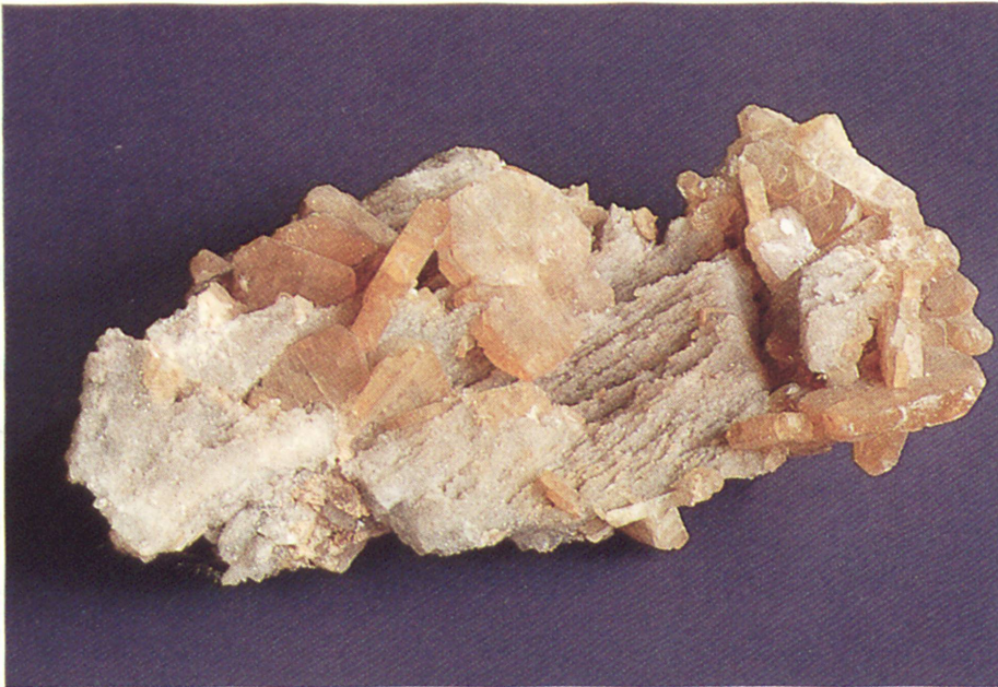
Schwerspat mit Quarz «Getreue Nachbar- schaft» – samt «Himmelfahrts»- Fundgrube bei Annaberg