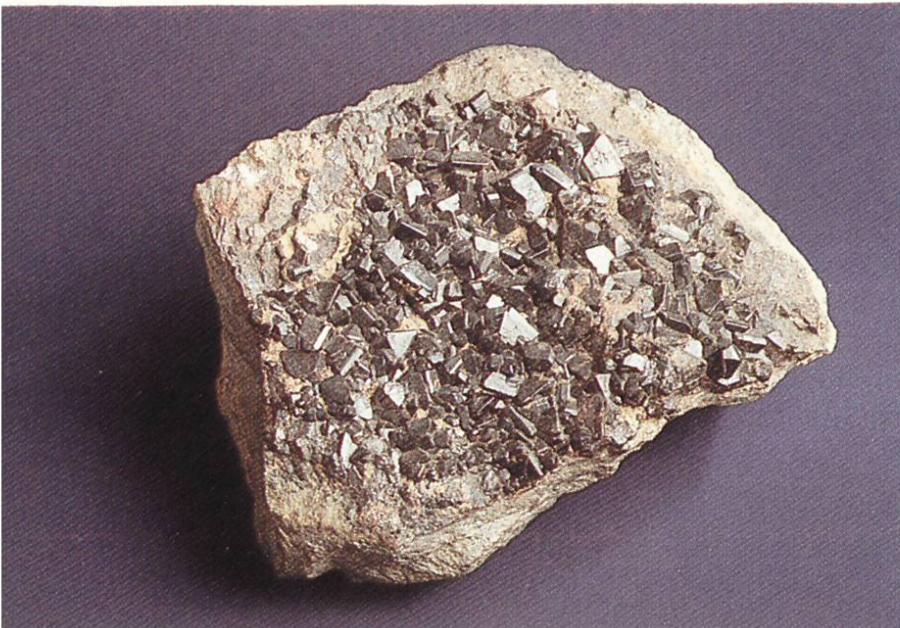
Kassiterit (Zinnstein) Fundgrube bei Ehrenfriedersdorf