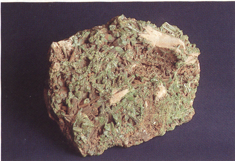
Pyromorphit (Grünbleierz) Fundgrube «Heilige Dreifaltigkeit» bei Zschopau