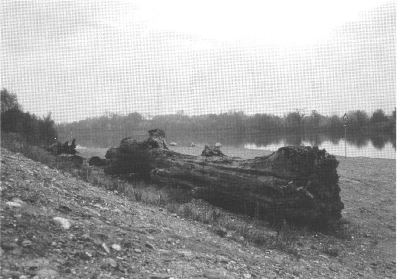
Figure 2.—L'étang de la gravière du Duzillet. Au premier plan, un tronc de chêne de gros diamètre, avec le départ des branches bien visible. Plus d'une centaine de troncs de ce type ont été extraits de la gravière.

d'eau d'environ 105 000 m 2 . Après l'arrêt de l'exploitation en 1993, le site a été aménagé pour les loisirs et la baignade (fig. 2).