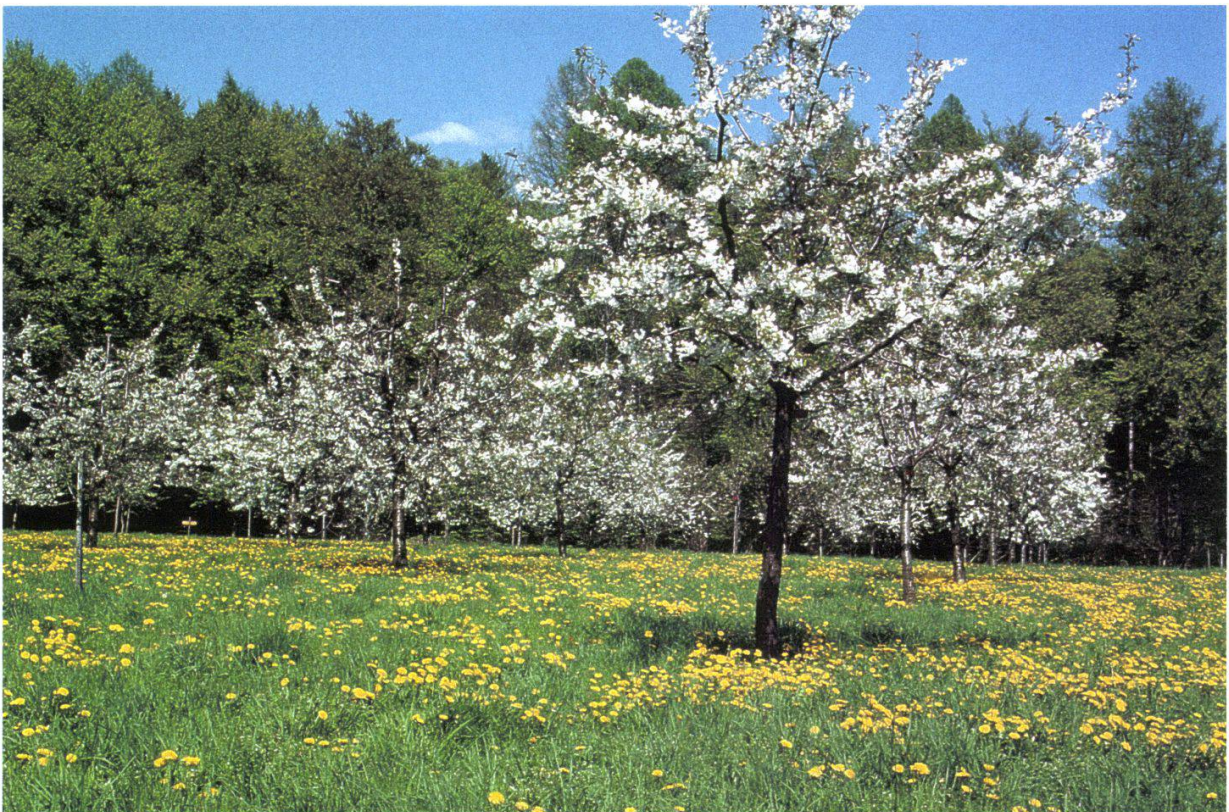
Figure 7.—Cerisiers en Crépon, avril 1999, forme haute tige.

Pour l'environnement, le verger traditionnel en haute tige est plus intéressant que le verger industriel en basse tige. Selon les expériences réalisées par des ornithologues, la surface minimale pour recréer un écosystème «verger haute tige» serait de 3 ha (fig.7). Dans le cadre du Crépon, on y arrive bientôt car, en plus des 2 ha, on peut ajouter en prolongement une allée de 20 cerisiers, la proximité de la forêt, et la parcelle des châtaigniers. Ainsi donc, le verger En Crépon accomplit simultanément deux missions: la collection et le système écologique.