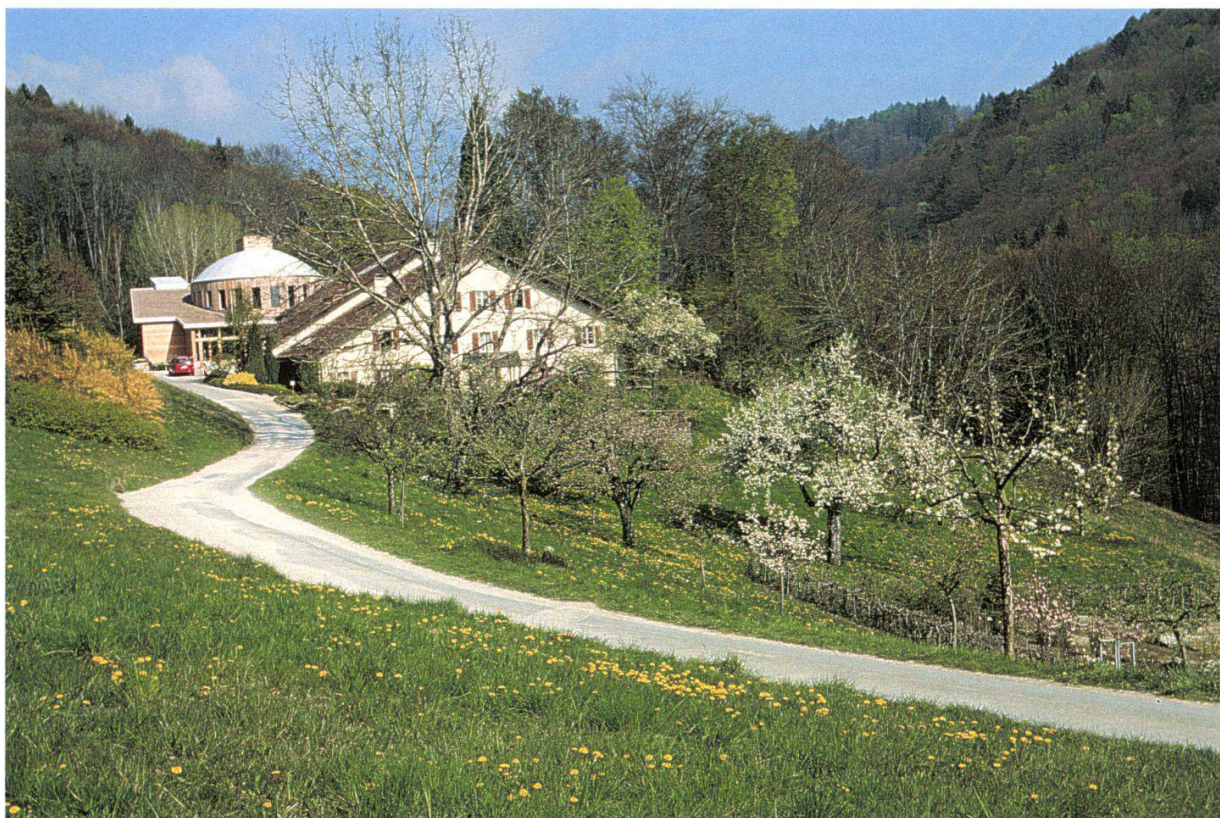
Figure 2.—Verger En Plan; le pommier en fleur pyramidal est le Rambour d'été.

curiosités, comme la pomme «Api étoilé», la «Griotte de la Toussaint» ou le noyer intermédiaire ( Juglans intermedia ) dont le rythme de croissance est stupéfiant.