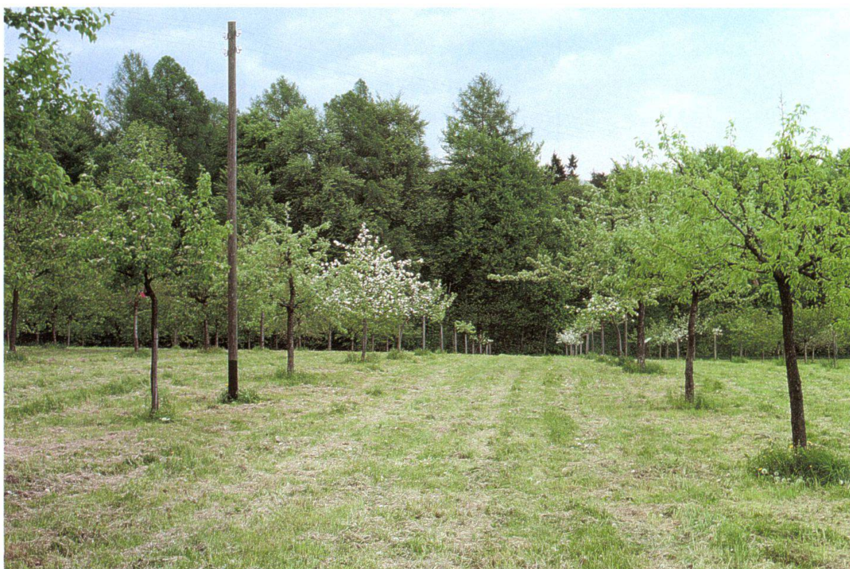
Figure 6.—En Crépon, le plus grands des vergers (2 ha).