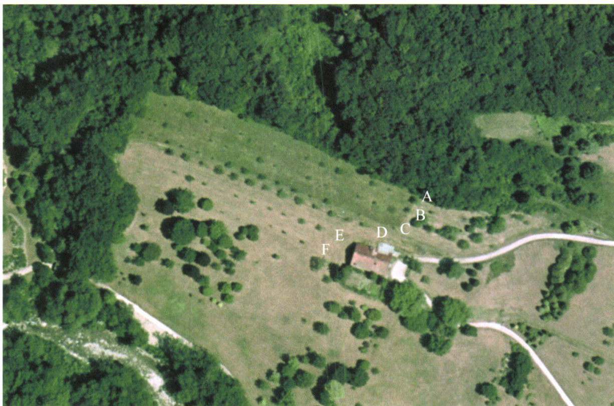
Figure 3.—Photo aérienne du verger en La Vaux. A: première ligne du verger, B: seconde ligne, etc. Reproduit avec l'autorisation de swisstopo (BA067857).