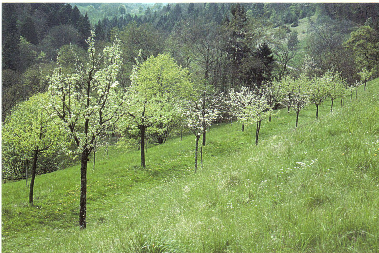
Figure 4.—Allée des poiriers en La Vaux.