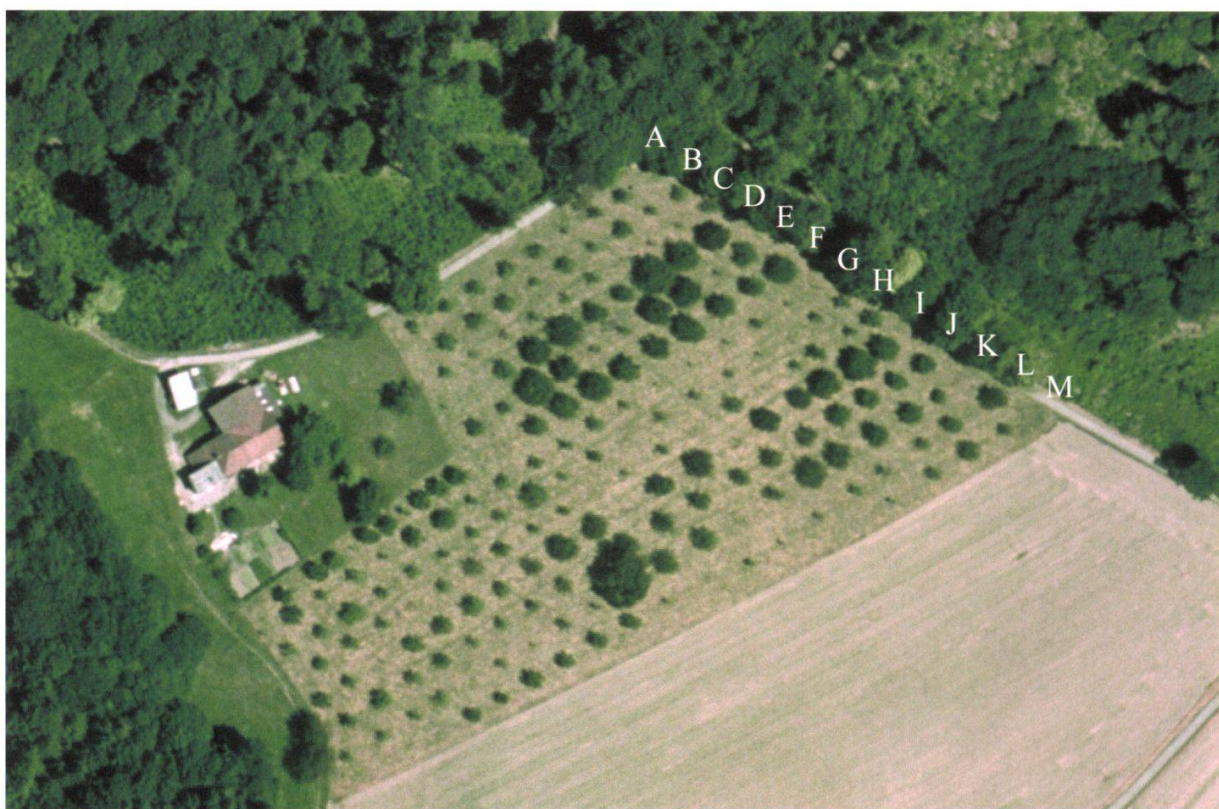
Figure 5.—Photo aérienne du verger en Crépon. A: première ligne du verger; B: seconde ligne, etc.