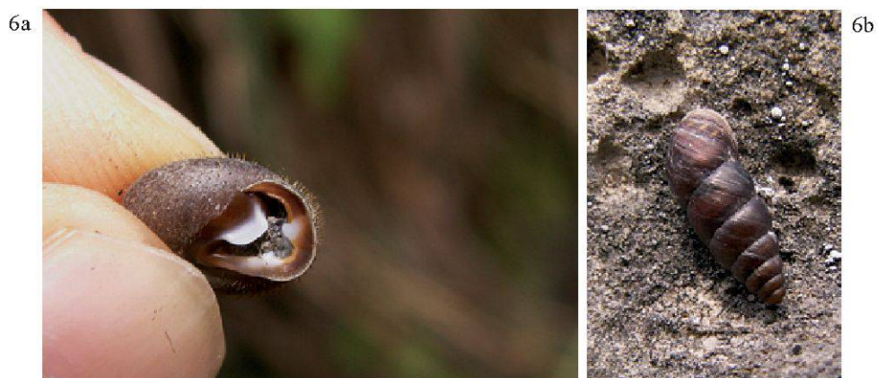
Figure 6.—Espèces présentes dans le Vallon de Nant: a. L'hélice grimace ( Isognomostoma isognomostomos ), facilement reconnaissable à son ouverture très particulière, est une espèce commune dans les forêts de montagne; b. Le maillot avoine ( Chondrina avenacea ) est une espèce typique des milieux rocheux, de préférence calcaires.