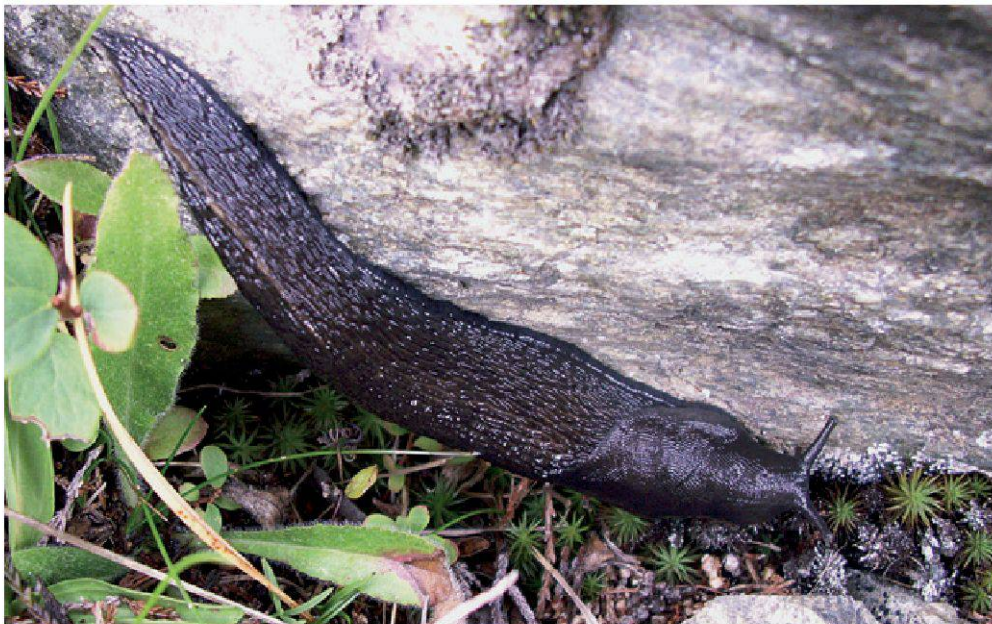
Figure 2.—L'impressionnante limace cendrée ( Limax cinereoniger ) est bien présente dans le Vallon de Nant. En extension, cette espèce atteint une taille de 10 à 20 cm (exceptionnellement 30 !) à l'âge adulte. (Photo: J. Fournier).