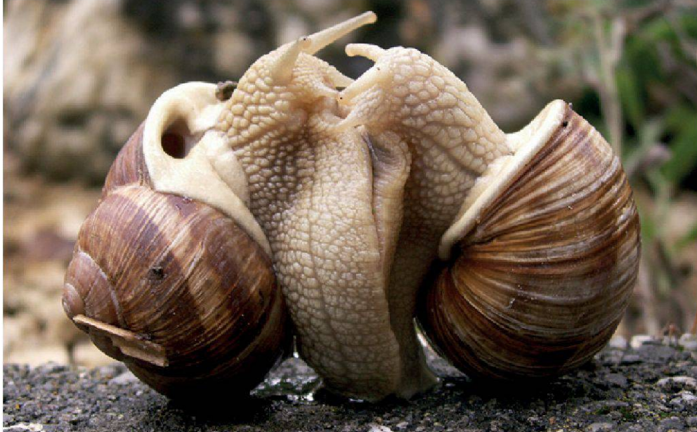
Figure 1.—Accouplement d'escargots de Bourgogne ( Helix pomatia ). La plus grosse espèce de gastéropode terrestre de Suisse, qui est aussi la plus connue du public, est abondante dans le Vallon de Nant, où de nombreux individus âgés, caractérisés par une grosse coquille blanchâtre et épaisse, ont été observés.