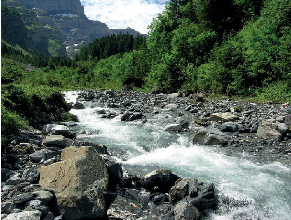
Figure 2.—L'Avançon de Nant, à la hauteur du hameau de Nant, station 11.