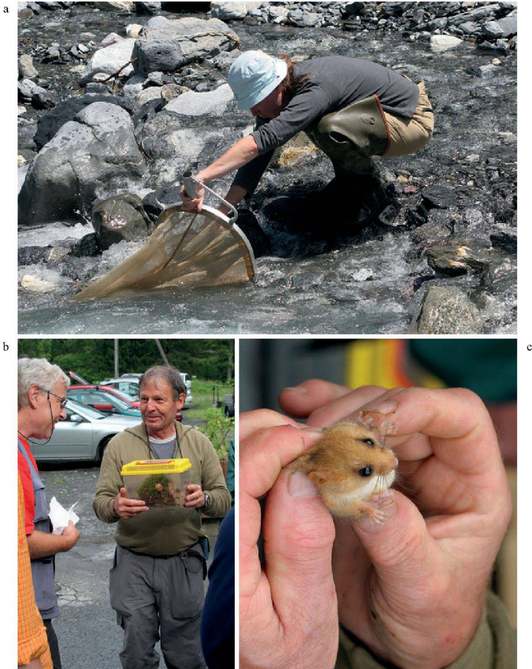
Figure 5.—Les Journées de la biodiversité 2008: a-b. Les naturalistes sur le terrain; c. Muscardin ( Muscardinus avellanarius ).