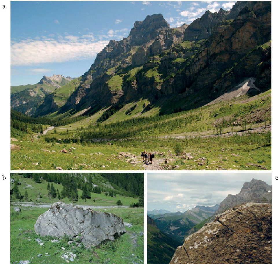
Figure 1.—Les différents milieux riches en lichens du Vallon de Nant: a. forêt en fond de vallée; b. blocs rocheux éboulés; c. blocs rocheux en place; b. roche de calcaire pur; c. roche de calcaire siliceux.