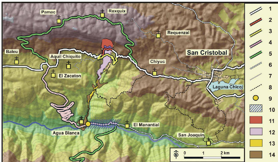
Figure 2.–Dommages causés par l'avalanche rocheuse du 4 janvier 2009 à la route 7W, et tracés de rechange proposés ou réalisés. 1- Tracé de la route 7W avant l'avalanche, 2 – Segment détruit, 3 – piste ouverte et maintenue par les communautés locales sur les dépôts d'avalanche, 4 – piste de rechange réalisée par le gouvernement sur avis d'expert en réponse d'urgence à la coupure de la route 7W, 5 – autres itinéraires de contournement proposés, 6 – pistes principales, 7 – pistes secondaires desservant les communautés, 9 – lieu de coupure de la piste (4) par les laves torrentielles, 10 – segment de la piste (4) inondé du fait du barrage de la rivière Chixóy, 11 – niche d'arranchement du 4 janvier 2009, 12 – dépôt d'avalanche associé, 13 – dépôts de laves torrentielles en juin 2009, 14- dépôts d'avalanche et de laves torrentielles produits par deux avalanches anciennes de même magnitude durant les derniers 8000 ans.

Face à cet événement, les autorités, les techniciens et les experts ont créés des routes alternatives qui passaient par le bas du glissement, au sud de la RN7 et par le haut, au nord de la RN7. Le trajet sur ces voies de remplacement nécessite plus de temps et constitue un risque important pour les camions car la chaussée est assez étroite. Parallèlement, les habitants de la communauté de Chiyuc, en collaboration avec des exploitants de gypse, des commerçants et des agriculteurs, ont construit un nouveau tronçon au même endroit que la route détruite par le glissement. Ils ont financé eux même la construction et l'entretien de la route et ils ont installé un péage pour récupérer l'argent investi. Ils ont choisi de restreindre le passage aux heures diurnes, passage qu'ils surveillent directement et qu'ils interdisent la nuit et en cas de pluie (figure 2). Presque tous les utilisateurs de la route (commerçants, agriculteurs, groupes de transports, voyageurs réguliers et occasionnels et habitants de