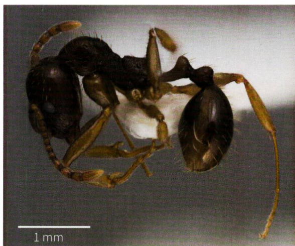
Figure 2: Aphaenogaster subterranea , espèce menacée au nord des Alpes.