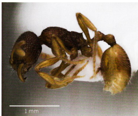
Figure 3: Stenamma debile , espèce vivant dans la litière des forêts de feuillus et de pins (photo: Marion Podolak, musée cantonal de zoologie, Lausanne).

M. scabrinodis , M. schencki et M. specioides , n'ont été observées que de façon très ponctuelle, et en partie grâce à du piégeage avec des appâts ou des pièges Barber (JURT 2006, SANCHEZ 2013). Ces données peu nombreuses restent intéressantes car M. scabrinodis , M. specioides et M. sabuleti sont souvent mal identifiées (SEIFERT 1988), et les connaissances concernant leurs distributions respectives doivent donc être mises à jour. Deux espèces de Myrmica ont été observées dans les zones humides, M. rubra et M. scabrinodis . Ce sont les seules fourmis recensées dans ce type de milieu.