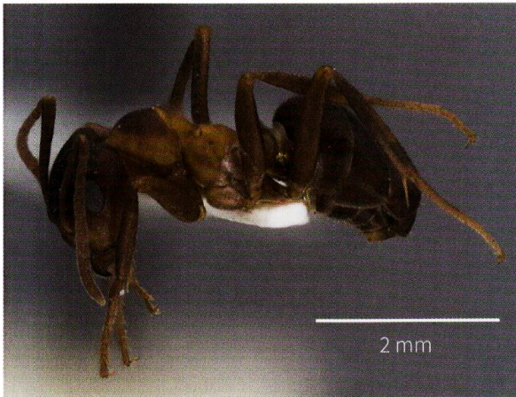
Figure 4: Formica bruni , espèce en danger d'extinction au niveau suisse, disparue du Bois de Chênes depuis sa dernière observation en 1984.