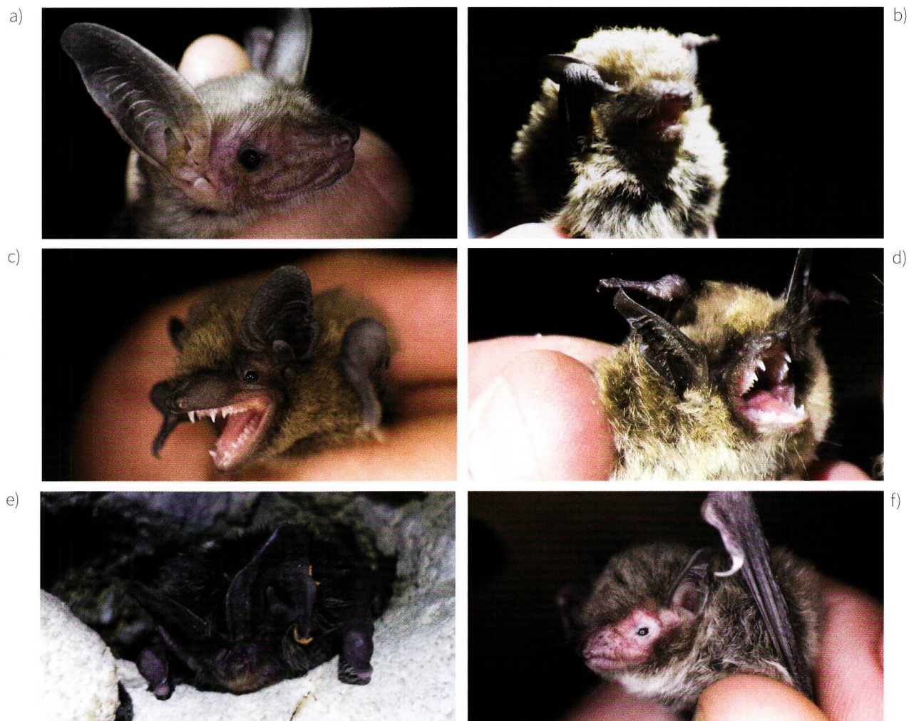
Figure 2. Espèces capturées dans le Bois de Chênes entre mai 2015 et août 2017. a. Grand murin ( Myotis myotis ). b. Pipistrelle commune ( Pipistrellus pipistrellus ). c. Pipistrelle pygmée ( Pipistrellus pygmaeus ). d. Murin à moustache ( Myotis mystacinus ). e. Barbastelle ( Barbastella barbastellus ). f. Murin de Daubenton ( Myotis daubentonii ).

La pipistrelle commune ( Pipistrellus pipistrellus ) (figure 2b) est quant à elle plutôt citadine. Cependant, c'est la chauve-souris la plus répandue en Suisse (GILLÉRON et al. 2015). Ce n'est donc pas surprenant d'avoir rencontré 8 individus de cette espèce dans le massif forestier. Elle chasse volontiers à proximité des lampadaires en milieu urbain mais s'adapte très bien au milieu forestier. Considérée comme sédentaire et non cavernicole, la pipistrelle commune peut s'accommoder d'un même gîte tout au long de l'année (changeant éventuellement de cavité au sein d'un même arbre).