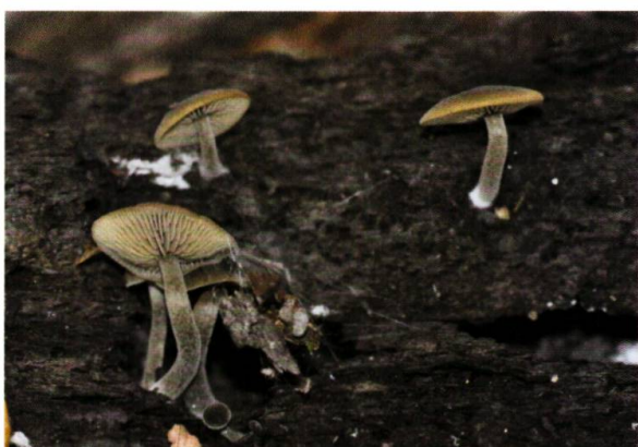
Figure 8. Simocybe olivâtre ( Simocybe centunculus), sur bois mort dégradé de feuillu, observé le 23.11.2016.