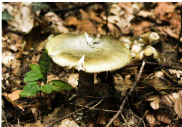
Figure 6. Amanite phalloïde ( Amanita phalloides ), espèce répandue au Bois de Chênes, observée depuis 1967, vénéneuse.