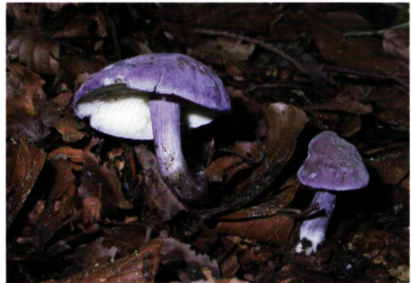
Figure 13. Calocybe violet ( Rugosomyces ionides ).