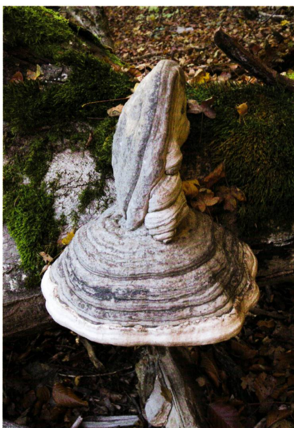
Figure 4. Amadouvier ( Fomes fomentarius ) sur tronc couché de hêtre.