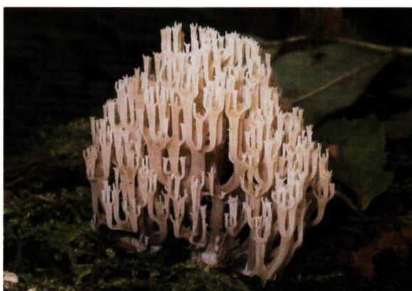
Figure 9. Clavaire à pyxides ( Artomyces pyxidatus), observé les 23.10.2016 et 30.9.2017.