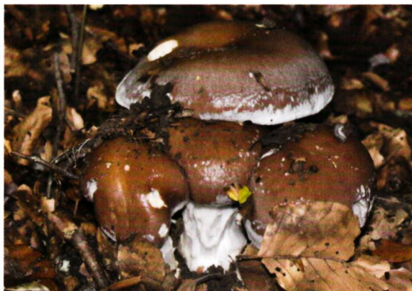
Figure 7. Cortinaire remarquable ( Cortinarius praestans ), observé depuis 1967.