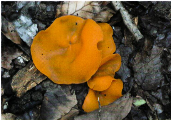
Figure 12. Pezize orangée ( Aleuria aurantia ), le long des chemins.

revanche, peu de recherches nous aident à comprendre l'influence de l'âge des arbres sur les champignons vivant au sol. Nos connaissances de la dynamique forestière suggèrent que les forêts anciennes avec une grande quantité de bois mort sont riches en espèces sapro-lignicoles (HEILMANN-CLAUSEN et al. 2003, KÜFFER & SENN-IRLET 2005) et plus pauvres en espèces terricoles que les peuplements forestiers avec des arbres plus jeunes (AYER et al. 2006, TWIEG et al. 2007).