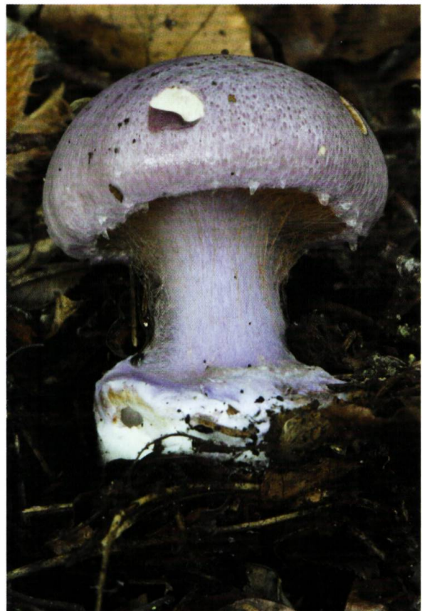
Figure 15. Cortinaire ( Cortinarius caerulescens) observé le 17.10.2012.