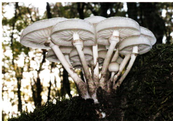
Figure 2 (à gauche). Collybie visqueuse ( Mucidula mucida ) sur tronc vivant de hêtre.