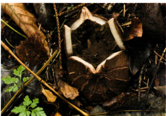
Figure 10. Géastre géant ( Geastrum melanocephalum), une rareté, observé le 2.10.2017.