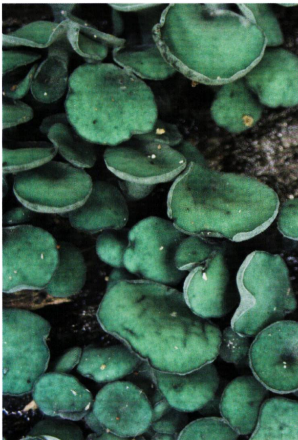
Figure 14. Pézize turquoise ( Chlorociboria aeruginascens ), sur bois dégradé de feuillu, colore le bois d'un beau bleu.