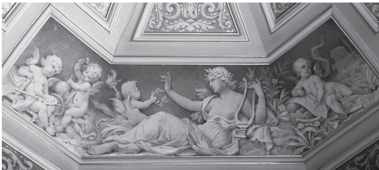
5 Berne, bureau du président du Conseil national dans le Palais du Parlement. Allégorie des Beaux-Arts.

d'allégories des quatre saisons; à la Salle del Castillo, des allégories du monde du spectacle et des lettres. La figure féminine de la salle de lecture du Palais de Rumine change quant à elle d'aspect et prend la forme d'un sphinx, qui se multiplie à l'identique dans tous les angles formés entre les arcades du plafond et les voûtes latérales. Elle est en lien avec des portraits d'hommes illustres de la scène régionale, traités sous forme de médaillons, seuls éléments qui varient d'un angle à l'autre. Le dessin de l'ensemble du décor, à l'instar de celui du Tribunal fédéral, est caractérisé par un trait stylisé et un cerne noir qui détache de manière nette toutes les figures du fond neutre 26 .