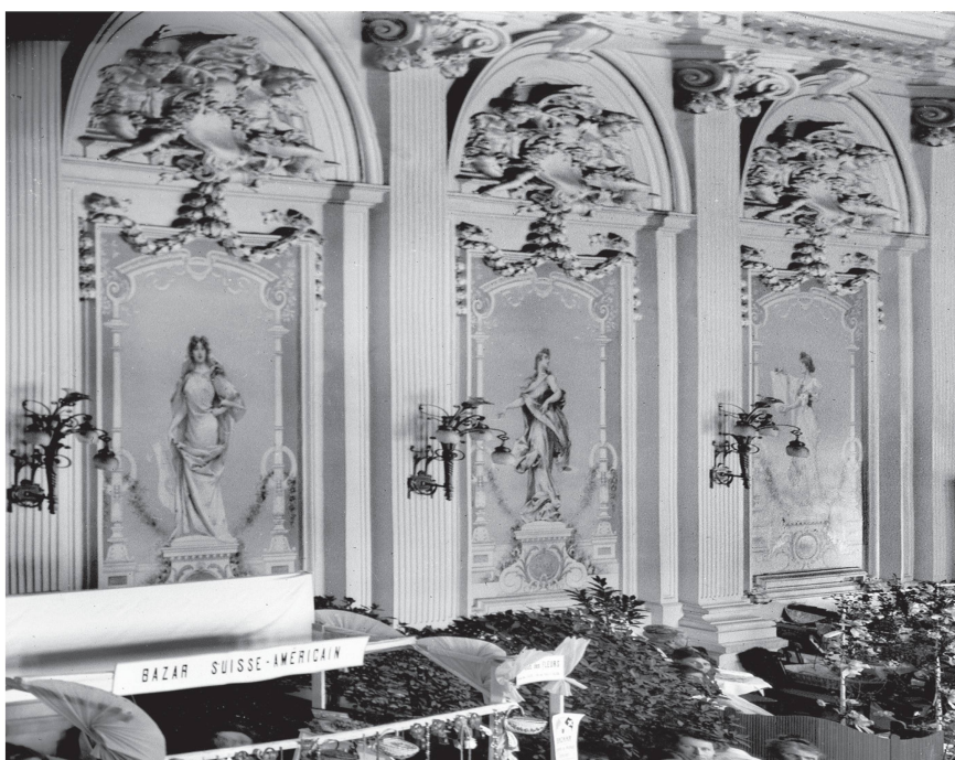
7 Vevey, Salle del Castillo de l'ancien Casino du Rivage. Vue ancienne de la paroi sud, plaque en verre, s. d..