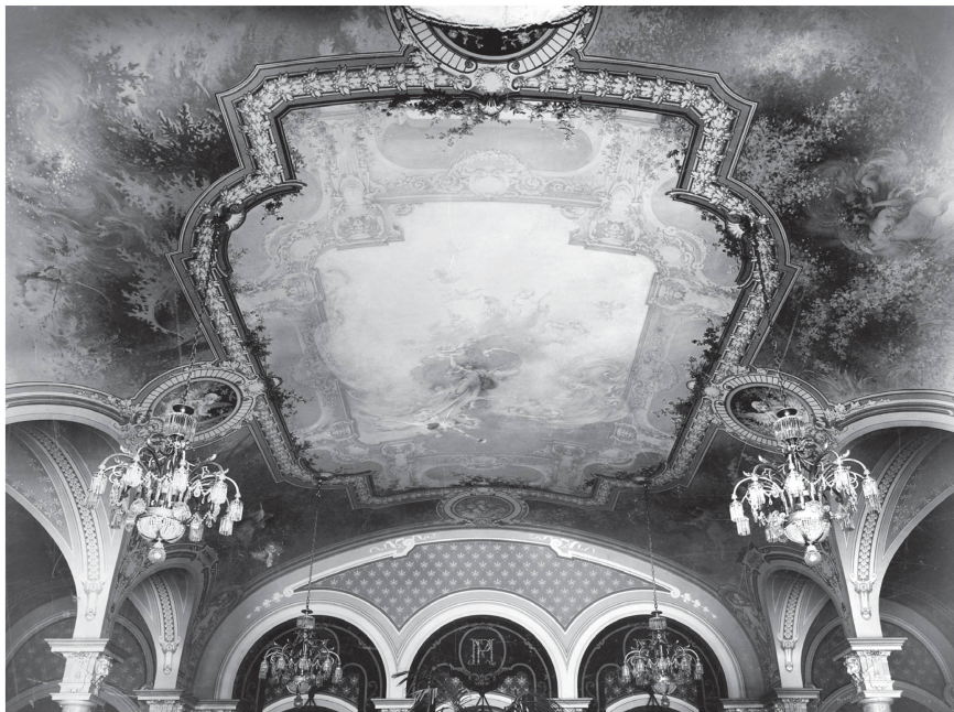
6 Montreux, hall originel du Montreux Palace. Vue ancienne du plafond (Musée de Montreux, Album du Montreux Palace, 1906. Photo Rémy Gindroz).

Les figures sont également de dimensions considérables et prennent gracieusement leur place à l'intérieur des baies, entourées d'un édifice de style néo-Renaissance inspiré des grotesques; le socle sur lequel elles reposent, ainsi que le reste du décor en staff de la salle, affichent un langage puisé dans le répertoire décoratif néo-baroque. Sur les photographies anciennes, il est possible de remarquer que les peintures possèdent une certaine qualité picturale, affirmée à travers le rendu plastique des figures 33 .