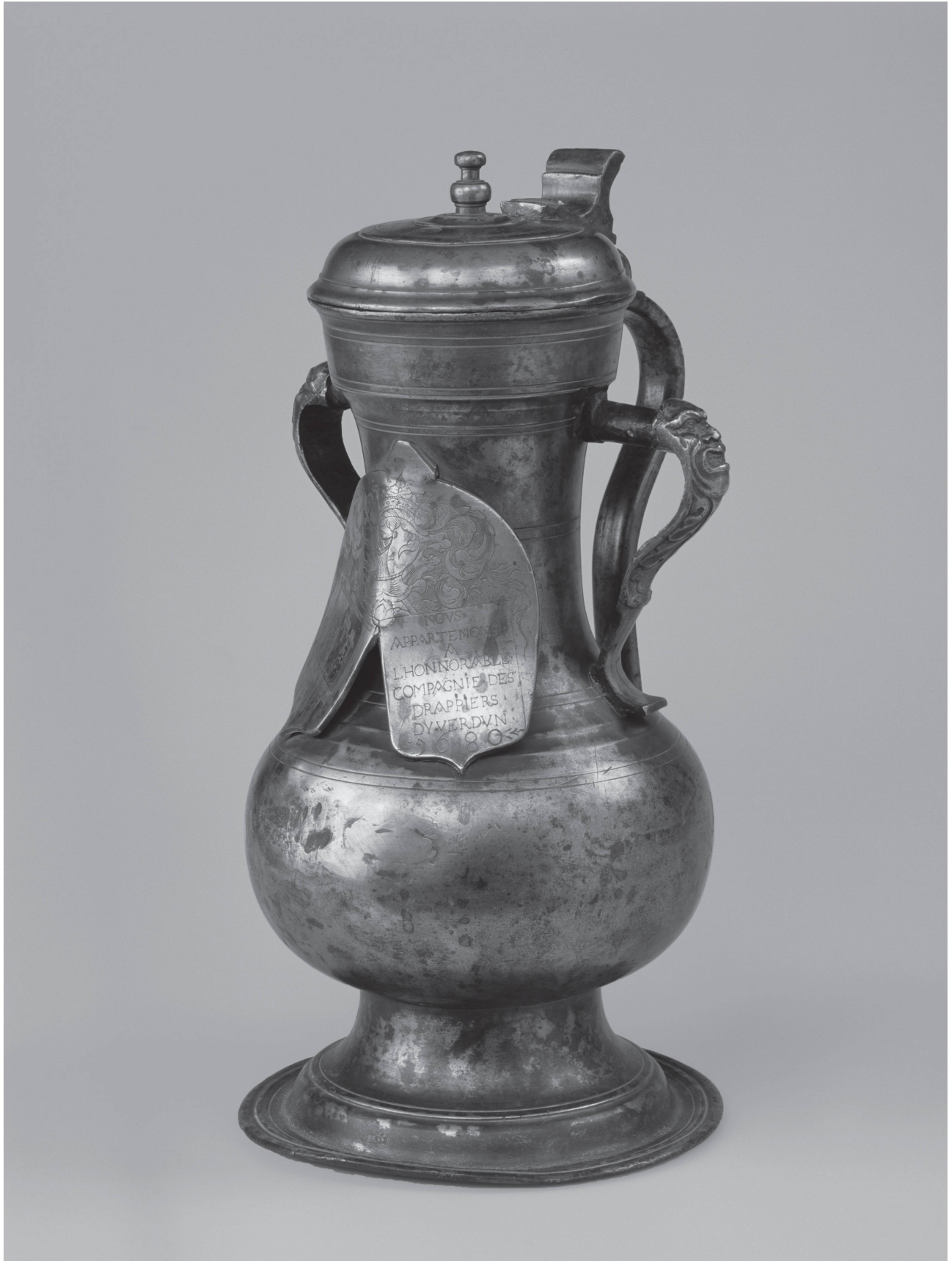
2 Channe de la compagnie des drapiers d'Yverdon, étain, 1680 (Collections du Musée d'Yverdon et région. Photo Fibbi-Aeppli, Grandson).