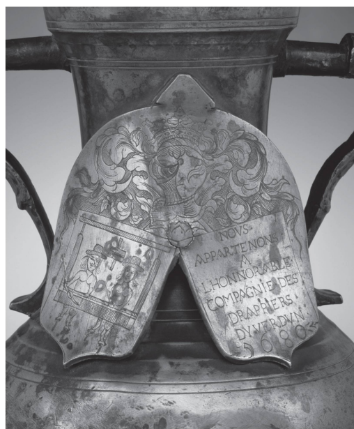
1 Double blason ornant la channe (Collections du Musée d'Yverdon et région.).

La production de ce genre de pièces corporatives en étain ou en argent est courante à partir du XV e siècle; étroitement associée au rôle croissant que jouent les corporations, elle reflète, dans la multitude, mais aussi dans le luxe des pièces produites 8 , la recherche de prestige de ces corporations et leur volonté d'affirmer leur identité. Ainsi, de