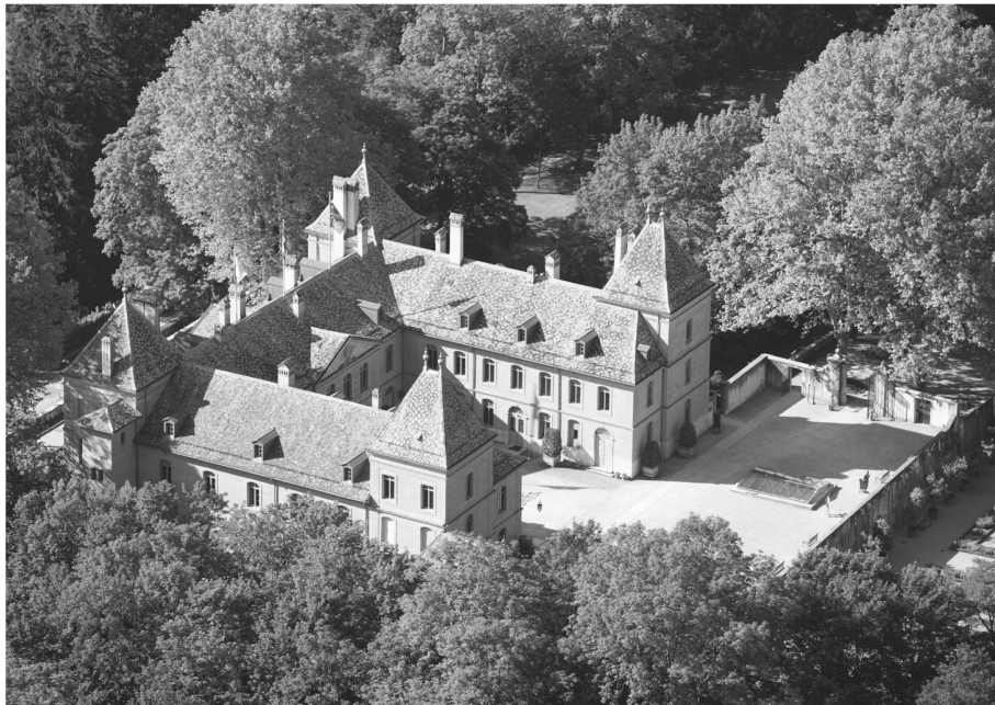
2 Vue aérienne du château de Prangins depuis le nord-ouest.