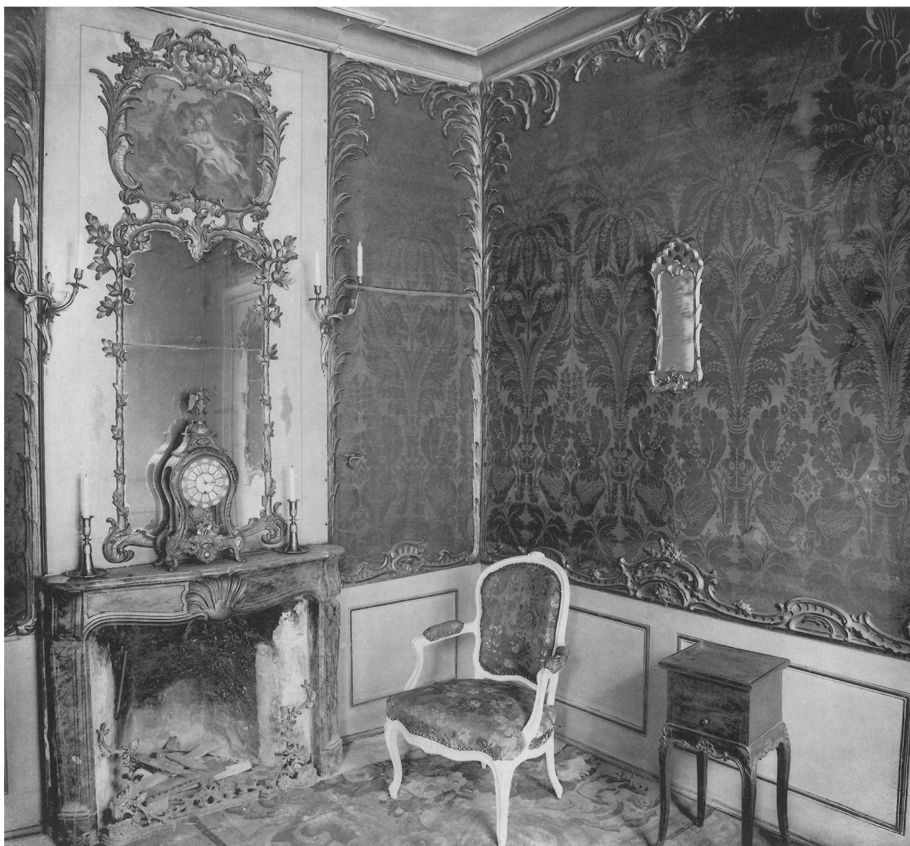
4 Vue du salon de la maison von der Weid de Seedorf à Fribourg (© Service des biens culturels du canton de Fribourg).

Désormais le décor s'adapte à la taille des murs, avantage considérable que ne présentent pas les créations des Gobelins. En reconstruisant le château de Prangins, Louis Guiguer n'était pas contraint de s'adapter à des aménagements préexistants, mais avait au contraire tout loisir de déterminer le décor intérieur à sa guise. Préférer aux nouvelles soieries qui font fureur la tapisserie, dont les origines remontent au Moyen Age et qui accompagnait les princes et les rois lors de leurs pérégrinations d'un château à l'autre, équivaut à s'inscrire dans la riche tradition du passé et à attester la noblesse de son ascendance 15 . Cette tentative de légitimation est compréhensible de la part d'un financier ayant récemment acheté un titre nobiliaire.