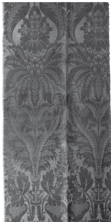
5 Fragment d'une tenture à motif de grandes feuilles et fleurs stylisées, dit damasco della palma, provenant du petit salon de la maison von der Weid de Seedorf à Fribourg, vers 1730-1740 (date du motif), damas de soie.