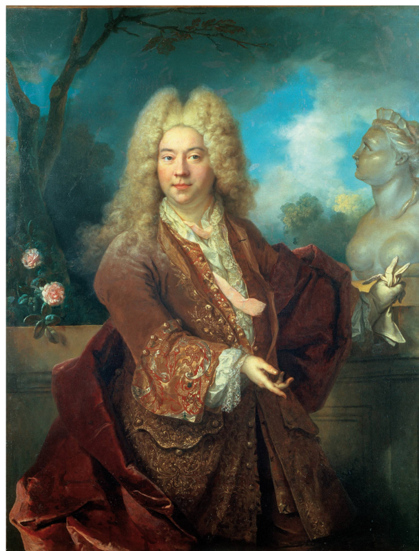
1 Portrait de Louis Guiguer, baron de Prangins, vers 1713-1714, huile sur toile, par Nicolas de Largillière.

En préambule, rappelons que la baronnie de Prangins est achetée en 1723 par Louis Guiguer, financier fortuné d'origine saint-galloise et un des plus importants banquiers de France sous la Régence ( fig. 1 ). Pour parfaire son ascension sociale, il ne lui manque qu'un titre de noblesse. Devenu baron de Prangins, il reconstruit le château à grands frais entre 1732 et 1739. Si l'édifice existe toujours, avec son corps central flanqué de deux ailes symétriques encadrant une cour d'honneur ( fig. 2 ), son mobilier a été dispersé et n'est plus localisé. Pour se faire une idée des ameublements et des décors, il faut donc se fier aux inventaires, qui sont «une source irremplaçable pour soulever les toits des maisons (...) et pénétrer dans l'intimité des foyers» 3 . Dressant l'état des biens d'une personne, le plus souvent fortunée, ils sont établis par un notaire, généralement après décès, par exemple lorsque le défunt est mort à l'étranger ou s'il laisse des enfants mineurs. Ces deux cas de figure s'appliquent à