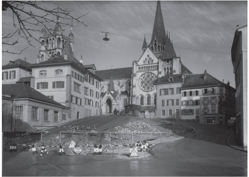
1 Réaménagement après la démolition de l'îlot Fabre, 1940 (MHL, photo Rodolphe Heutger).

La conséquence de cette démolition, à savoir le dégagement de la Cathédrale, ouvre des débats sur l'avenir du projet. Les adversaires de l'idée d'ouvrir la vue sur le monument prétendent que la disparition de ces maisons porterait préjudice à son esthétique.