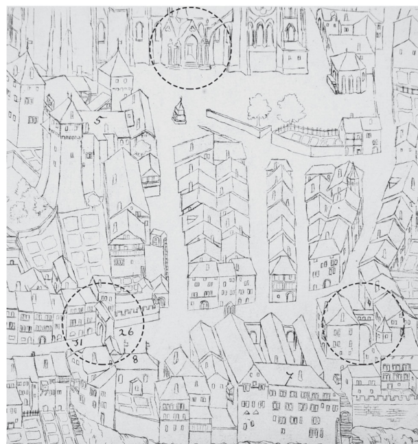
7 Rapport entre l'entrée initiale de la Cathédrale avec les îlots et les rues situés au sud de celle-ci et les portes de la Cité-Dessous. Détail de la reproduction du plan Buttet (1638) par Ch. Vuillermet, 1896.

pour ce dernier groupe. En outre, depuis la Réforme, la Cathédrale de Lausanne, comme l'explique Sylvain Malfroy 10 , commence à perdre ses dépendances contextuelles et devient plus un objet d'art, qui peut être apprécié de loin, qu'un représentant de la vie liturgique lausannoise, qui devrait être compris dans le tissu bâti. C'est dans ce contexte de besoin en matière de circulation et de recherche esthétique que la démolition de l'îlot Fabre est vivement souhaitée par les défenseurs du projet de démolition.