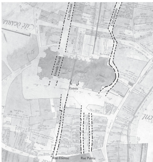
6 Système de la voirie primitive autour de la Cathédrale par rapport à son entrée initiale. Assemblage des extraits du plan cadastral Melotte (fol. 3 et 5), 1727 (AVL).