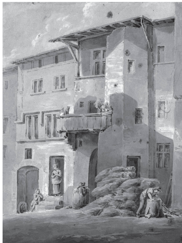
11 Vue d'une vieille maison à avancée polygonale et balcon en bois à la rue Louis-Curtat (Jean-Pierre-Samuel Naef, Maison de la rue Fabre, lavés sépia sur papier, vers 1825, MHL).

La réflexion sur la question de l'intérêt contextuel des monuments a déjà fait couler beaucoup d'encre. Cependant il n'est plus à démontrer qu'un grand monument voit sa valeur augmenter de par son contexte visuel et spatial et parmi les masses où il a pris naissance. Ce que cette étude a tenté de mettre un peu plus en lumière est que, dans le cas de la Cathédrale de Lausanne, l'intérêt contextuel de ce groupe d'immeubles ne se situe pas seulement en termes visuels, mais aussi en termes d'approche et d'accès au monument. La morphologie des rues tisse un lien avec l'entrée de la Cathédrale et non pas avec son volume en tant qu'objet. L'entrée de la Cathédrale ayant déjà été déplacée de la face sud au côté ouest et le bâtiment lui-même ayant perdu avec la Réforme sa vie liturgique initiale, les immeubles qui l'entourent – dont ceux de l'îlot Fabre – et les chemins qu'ils dessinent ont par conséquent aussi perdu leur raison d'être initiale dans leur position par rapport à la Cathédrale.