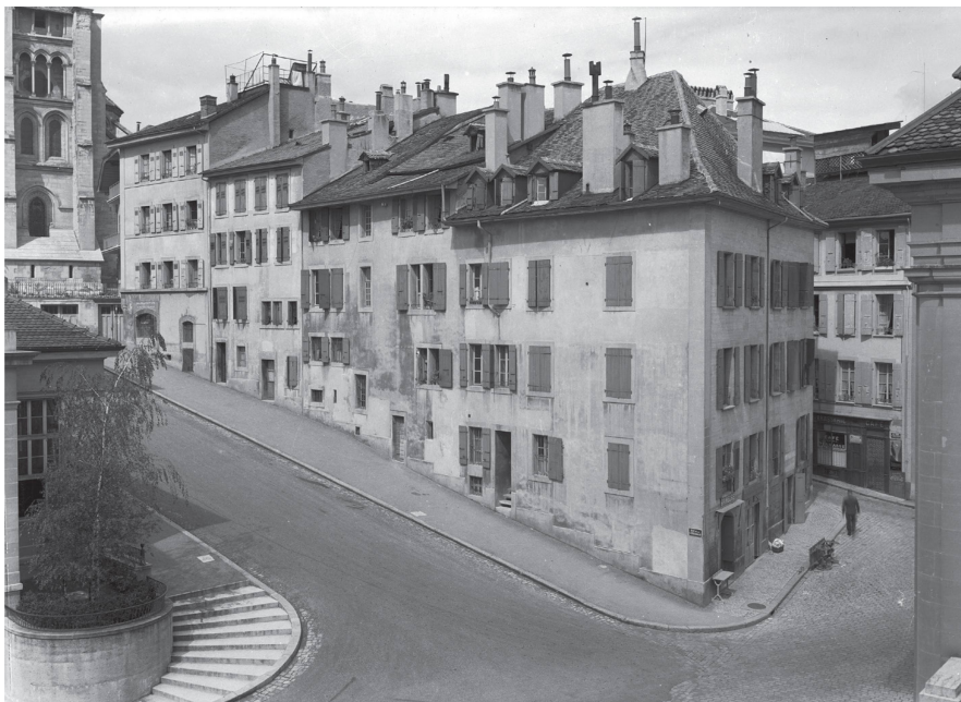
4 Angle sud-ouest de l'îlot Fabre. La surface de la rue qui amène à la Cathédrale et qui longe la face ouest de l'îlot en question fut jadis occupé par un îlot étroit, racheté entre 1873 et 1881 à divers propriétaires par l'État de Vaud, puis démoli. La rue ainsi créée perdit son tour, entre 1886 et 1895, la plupart des maisons qui la bordaient à l'ouest, appuyées au canal des égouts de la Cité. De toute cette rangée, il ne reste que l'élément supérieur, incorporé maintenant à l'ancienne maison Gaudard.