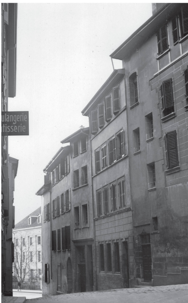
5 Façades orientales de l'îlot Fabre, 1938.