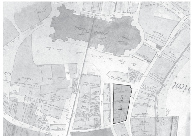
2 Plan de situation de l'ancien îlot Fabre. Assemblage des extraits du plan cadastral Melotte (fol. 3 et 5), 1727 (AVL).

La question de l'insalubrité de certains logements de la Ville avait attiré, pendant plus d'un demi-siècle, l'attention de l'opinion publique, en provoquant des critiques. En 1893, le Conseil communal charge la Municipalité de procéder à une enquête – dite « enquête Schnetzler » 6 – sur les conditions de logement. Les résultats ont servi à identifier les immeubles destinés à être démolis, dont les « immeubles antihygiéniques » 7 de l'îlot Fabre. Sur ce point-là, les décideurs et les citoyens partagent le même avis.