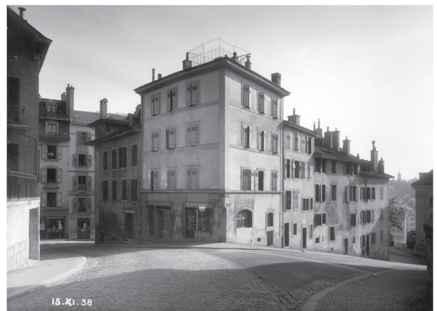
3 L'îlot Fabre depuis la place de la Cathédrale, 1938.