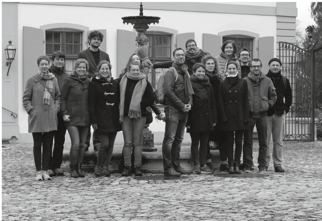
2 Voyage d'études dans le canton de Bâle, 2016, devant le château d'Ebenrain à Sissach ( Architecture & Patrimoine, UNIL ).