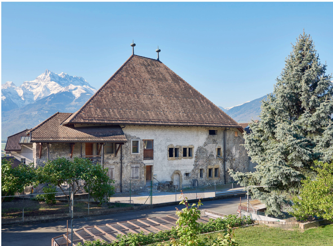
1 Le Château de la Roche et les Dents du Midi, 2017.