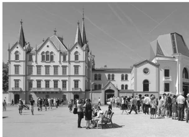
2 Arrêt du Clou rouge à Vevey en 2018 (© Patrimoine suisse, section vaudoise. Photo Michel Barraze, 2018).

La section vaudoise a développé divers outils afin de mieux communiquer et toucher son public. Son journal À Suivre informe les membres sur les activités organisées et ses