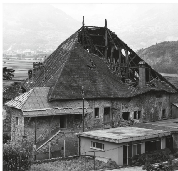
3 Le Château de la Roche, photographié après l'effondrement du toit en 1982.