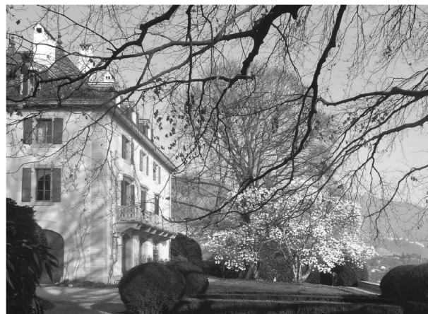
1 Le domaine de La Doges.