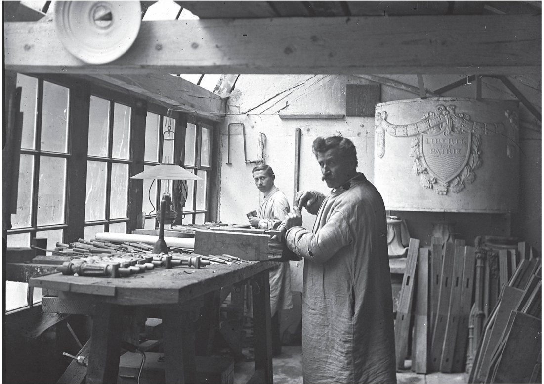
3 Atelier des sculpteurs, situé au pied du bas-côté sud de la grande travée, entre 1895 et 1906 (ACV, SB 52 Ab/15/9).

(statuaire et enveloppe architecturale, 1968-2009), la tour de chevet nord (façades, 1967-1970), le déambulatoire et le chœur (charpentes et couvertures, 1980-1982), la tour-lanterne (consolidation et restauration des superstructures et de la charpente, couverture en ardoises, 1988-1994), le croisillon sud du transept (consolidation et restauration, vitraux de la rose, 1995-1998), la nef et le portail peint (façades et arcs-boutants, 2000-2009). Malgré cette longue énumération, de nouveaux programmes de travaux sont déjà mis sur pied. La cathédrale est un chantier permanent, requérant pour sa conservation un entretien régulier approfondi – comme la campagne achevée en 2009 l’a démontré avec force –, conjugué à des opérations d’envergure pour rattraper des défauts de maintenance.