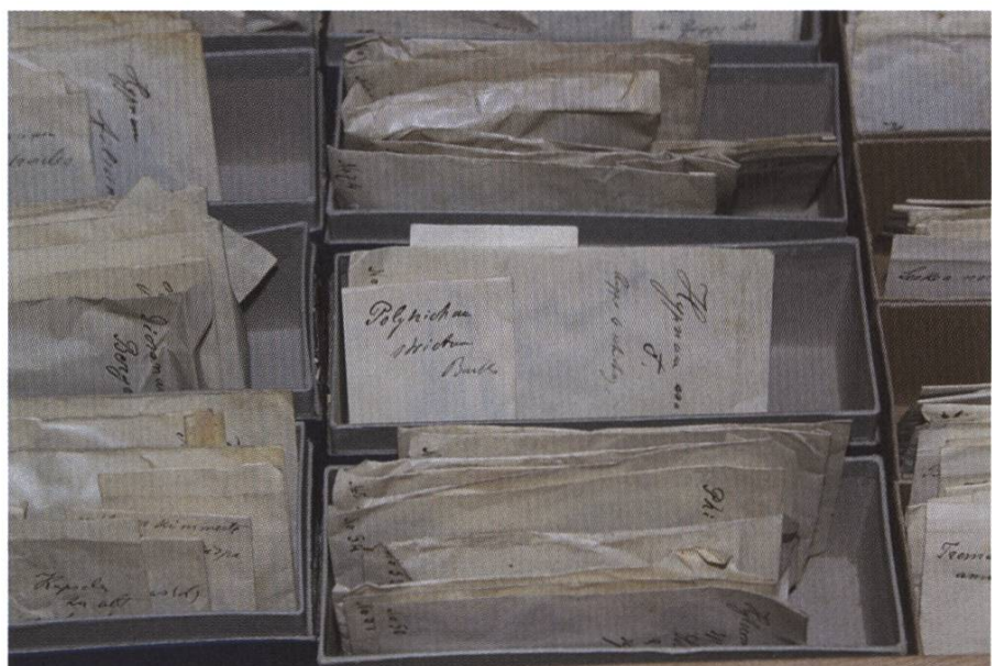
Die Proben wurden zur Dokumentation vor der Stauung des Sihlsees gesammelt.