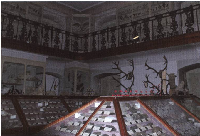
Umfangreiches Naturalienkabinett im Kloster Einsiedeln

Seit Beginn des 19. Jahrhunderts standen die Naturalienkabinette im Zusammenhang mit der Einführung der Naturkunde in den Fächerkatalog der Schulen. Die Sammlungen waren Instrumente der Didaktik und wurden von Mönchen oder Nonnen angelegt und unterhalten, die selbst Naturkunde unterrichteten.