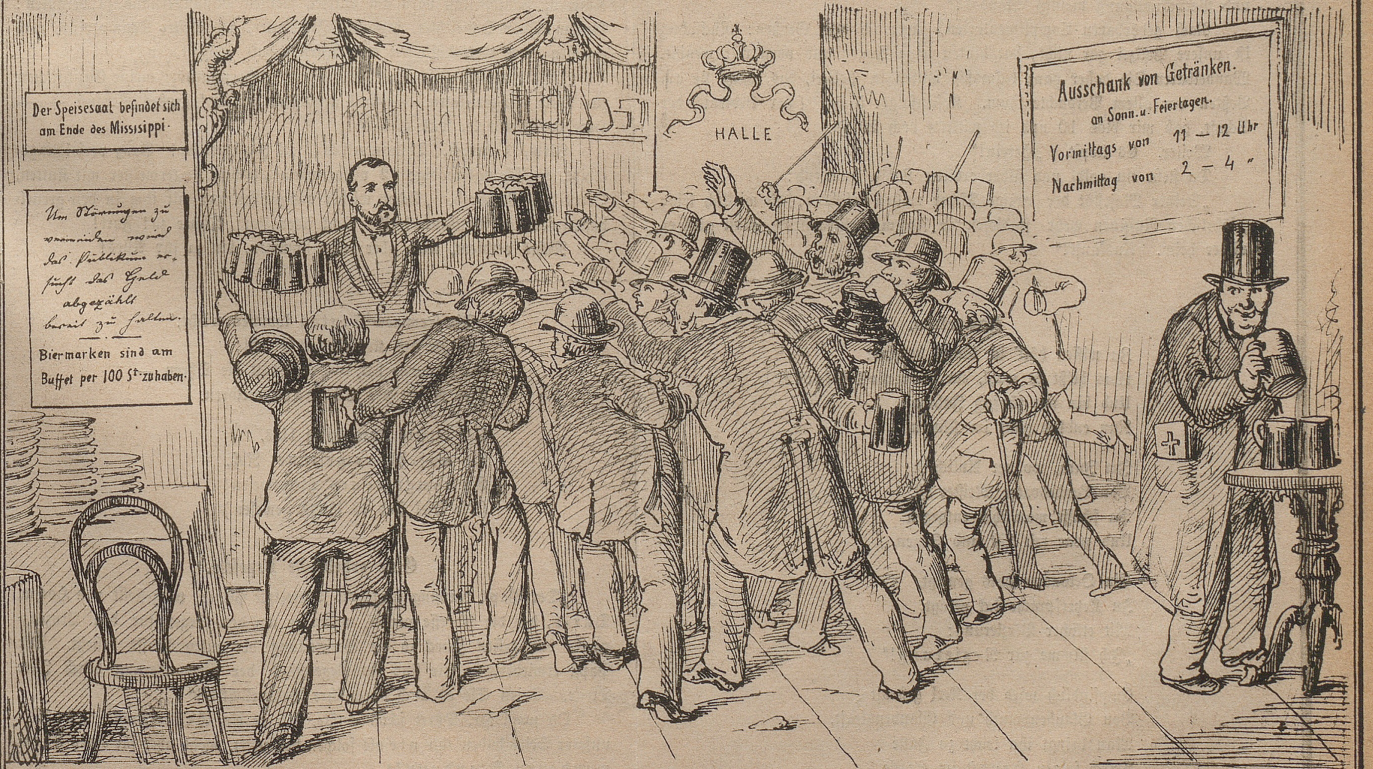
Die Ausschankung geistiger Getränke soll am Sonntag auf eine gewisse Anzahl von Stunden beschränkt werden. — Vorschlag: Lombard in Genf.