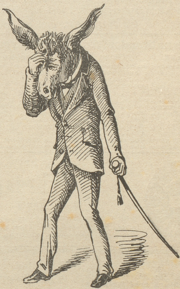
Eine dumme Behauptung.