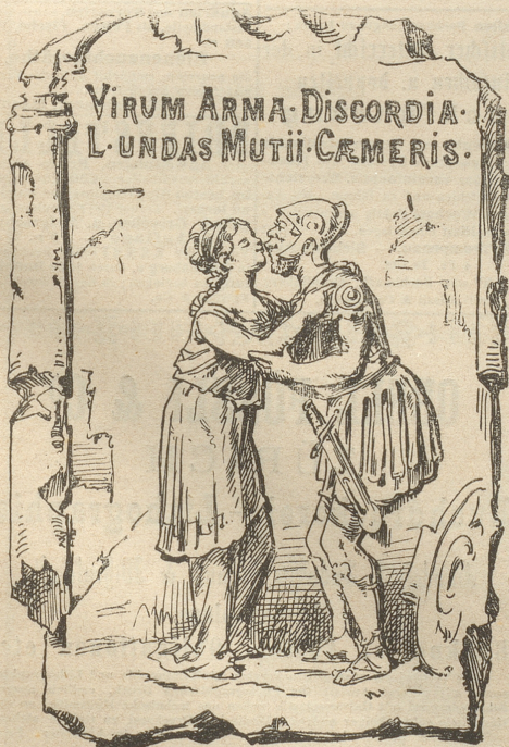
(Auflösung folgt in nächster Nummer)