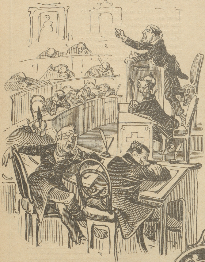
Bei uns schläft man ganz wonniglich;