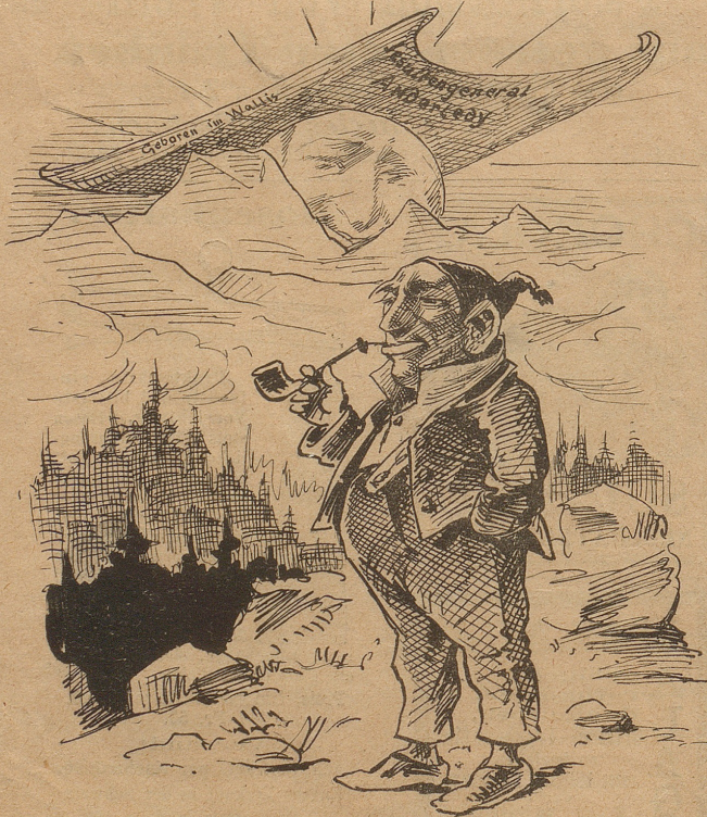
„Ob die Walliser am Glanze ihres Mitbürgers wohl noch schwarzer werden können, als sie sonst sind?“