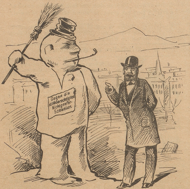
Genfer Konservativer: „Na, der ist mir famos gelungen, der wird beim Volk schon wirken!“