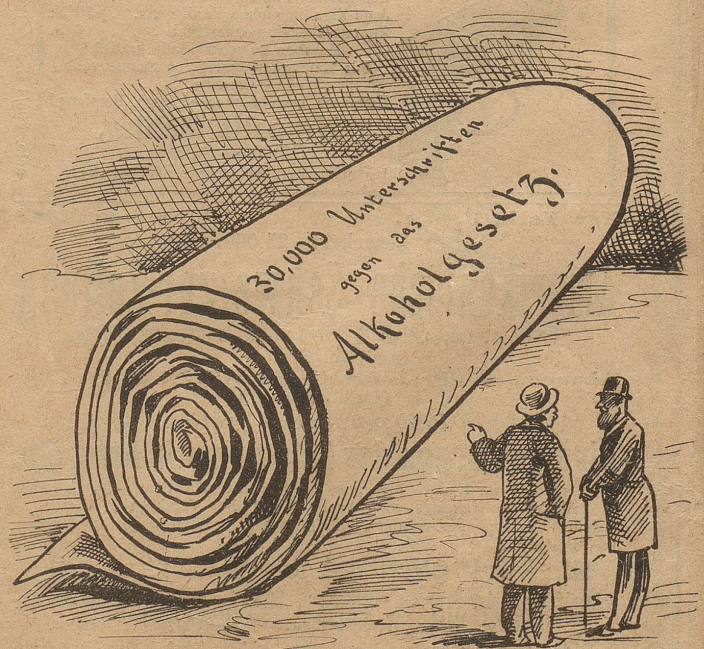
A.: „Sie, sind das etwa die Anmeldungen für den Pariser Verein für Kurzsichtige?“ B.: „Ja, was weiß ich; so weitsichtig bin ich nicht.“