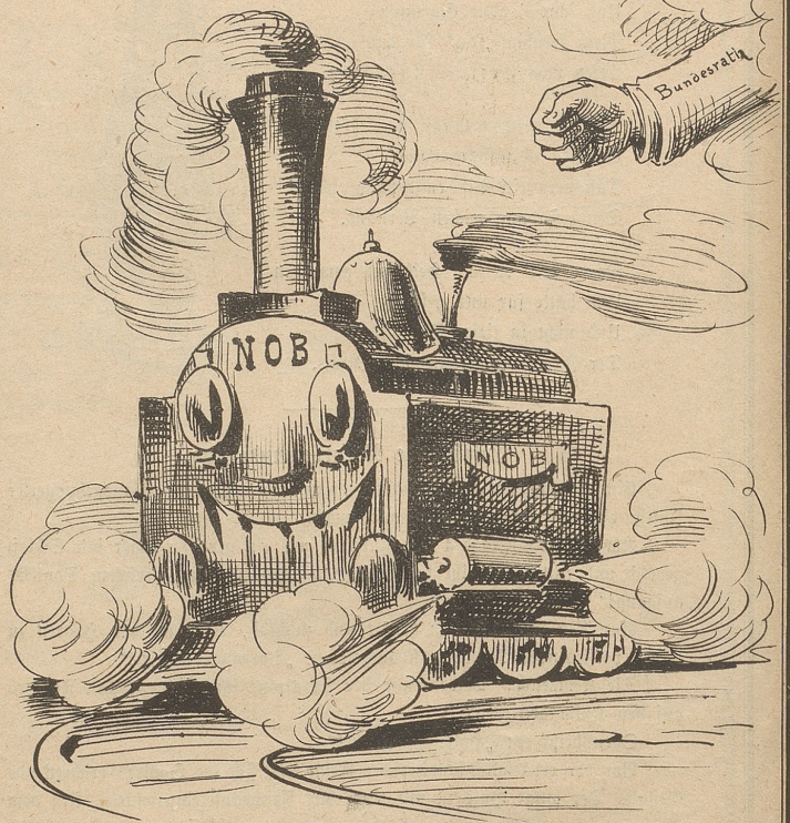
„Was, Du Ungeheuer, Du röhelst noch?!"