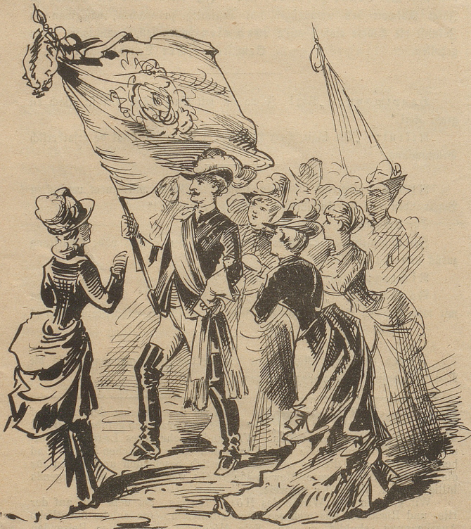
hat ihre beneidenswerthen Leute. O Fährdrich!