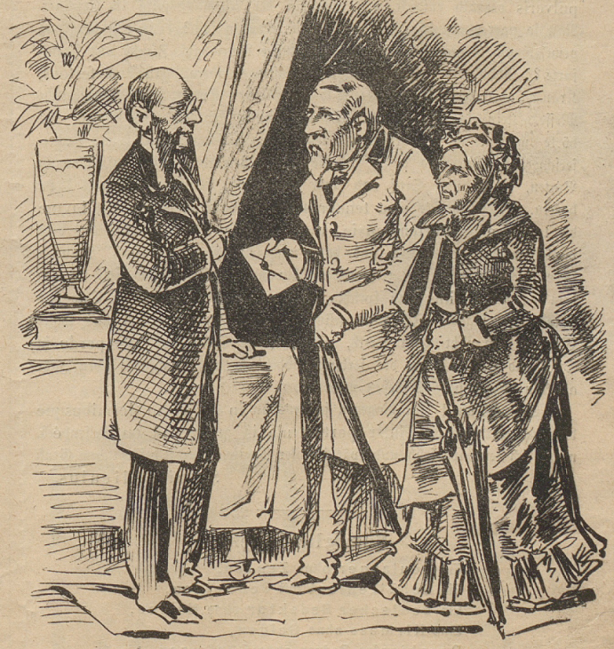
Die Eltern Boulanger's

haben dem Ferry »wüst« gesagt, meinte der richtige Politiker, als er las: »Boulanger schickte Ferry seine Zeugen!«