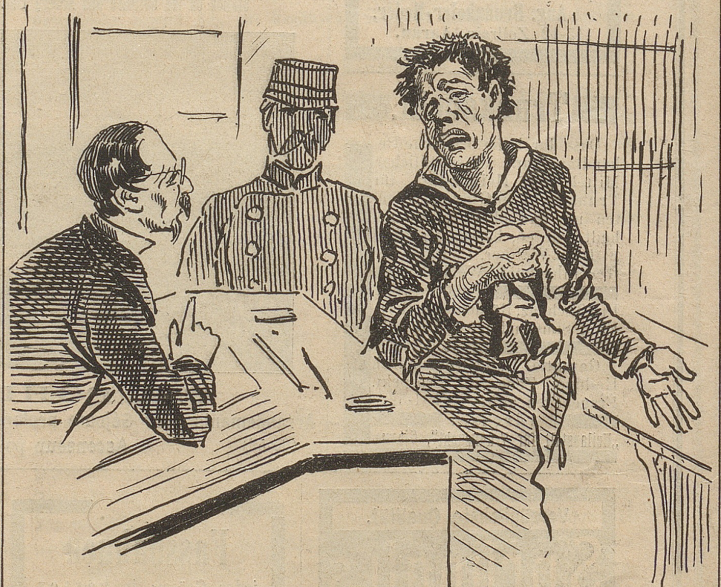
Vagabund: „Ja, Herr Richter, 's ist zum aus der Haut fahren, daß ich nicht derjenige bin, der die 850,000 Fr. stahl und den man aber nicht erwischte.“