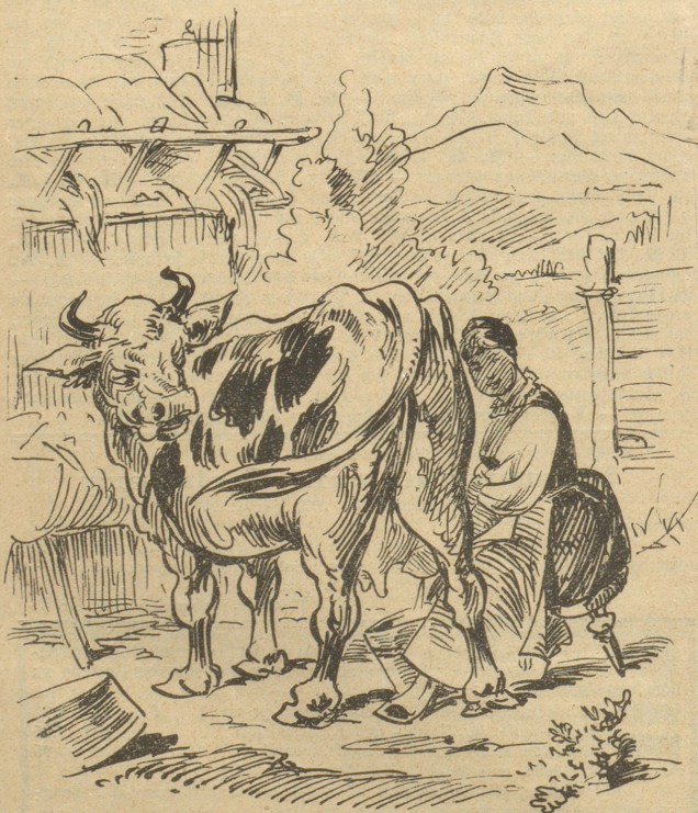
Bisher mußte man die Kühe so melken,