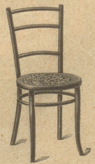
N o 63.

Grosse Auswahl in Restaurations-, Speisesaal- und Zimmer-Sesseln.