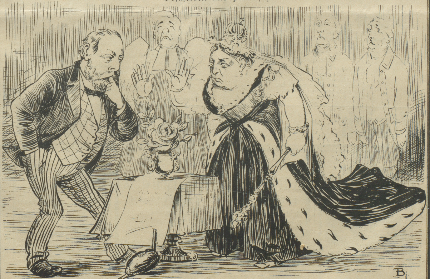
Viktoria: „Was, mir die Tugendrose geben wollen? Das ist doch unwer Wales: „Hm, liebe Mama, s ist echtes Gold, non olet!“