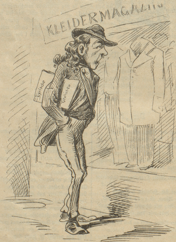
trachtet der Dichter nach einer dichterem Tracht.