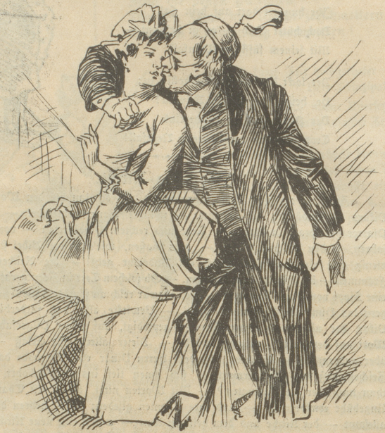
Der Herr kennet die Seinen.