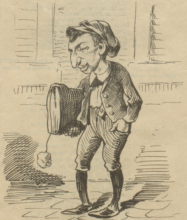
früh krümmt sich, was ein Hachen werden will.