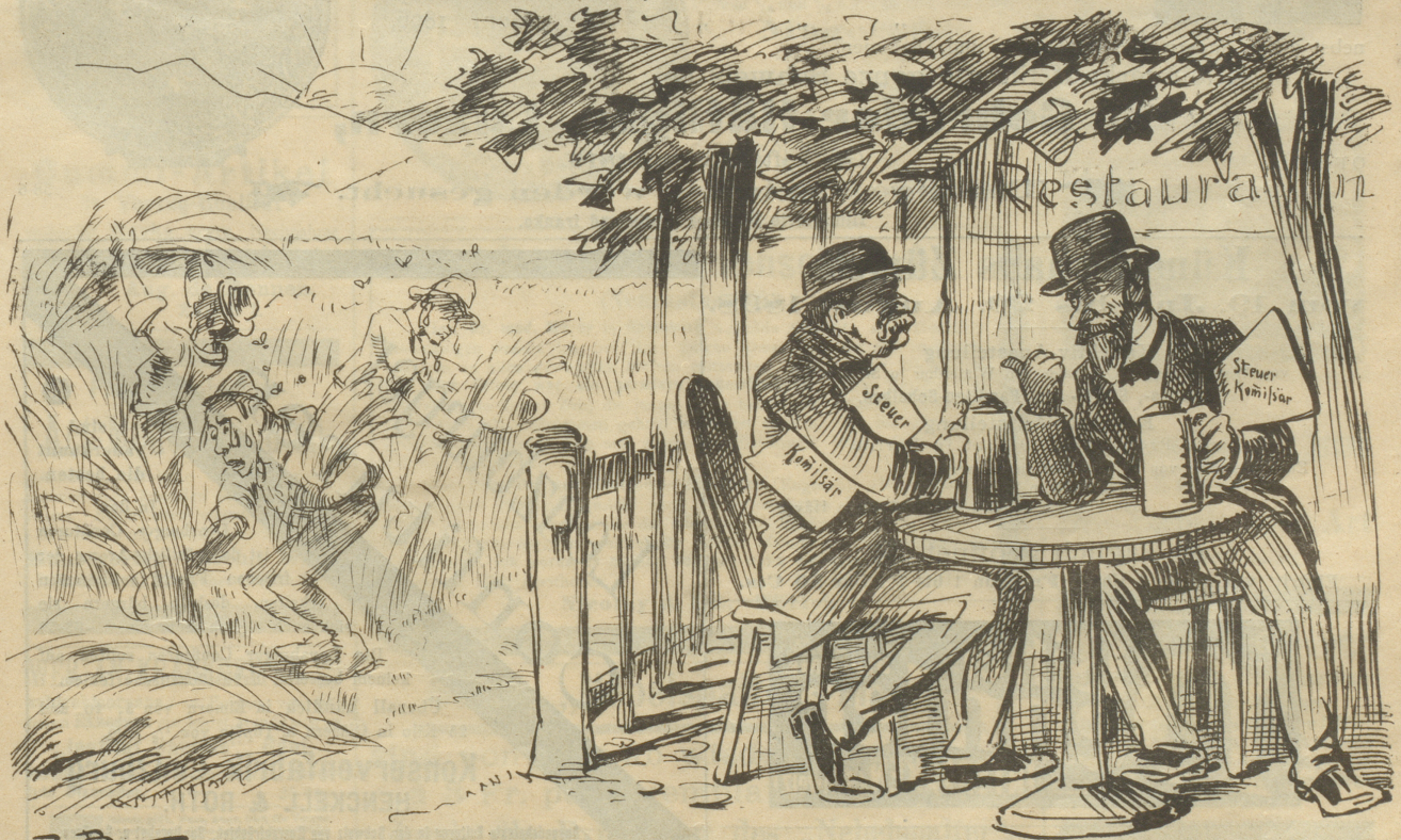
„Bruder, ich denk', es werde am besten sein, energisch vorzugehen. Siehst du, wie sie alle schwitzen? In diesem Zustande vertragen sie's am besten, wenn man die Schraube etwas anzieht.“