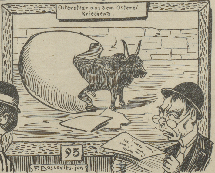
Ostertier aus dem Osterei kriechend. 93