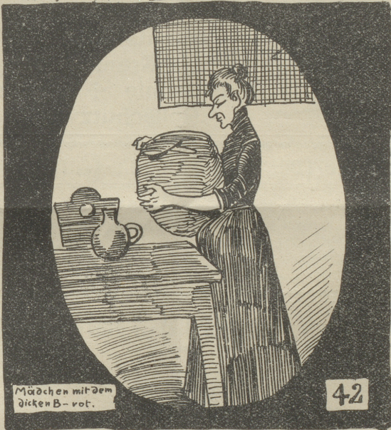
Mädchen mit dem dicken B-vot. 42