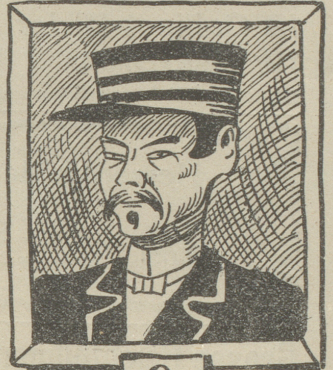
Ein Japaner. 2