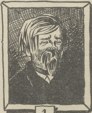
1 Ein Russe.