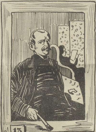
13 Maler, seinen Rahmen frisch ansreich- end.