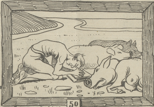
Anbetung der Schweine. 50