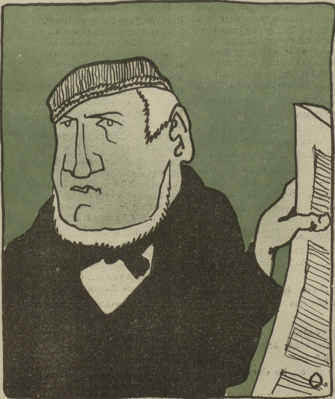
Da heißt Optimist, dann wieder Pessimist; das ist sicher wieder so ein neuer Kunstdünger. Ich bleibe beim Kuhmist!