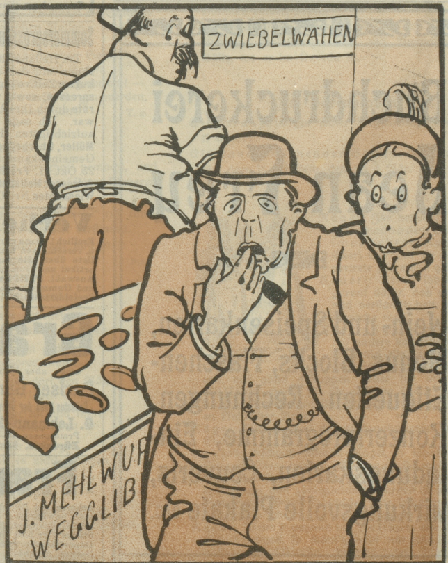
Queg, Zilli, das ischt emal äs Zinkereggli rote's de Bruuch ischt.